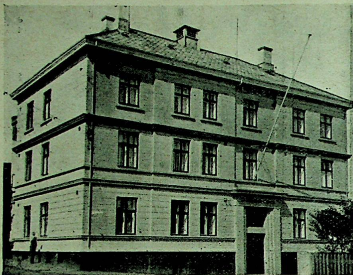
St. Fransiskus Hospital i Stavanger.

og blandt dem var også vår plass, og vårt livs mening var å søke, finne og utfylle denne plass.