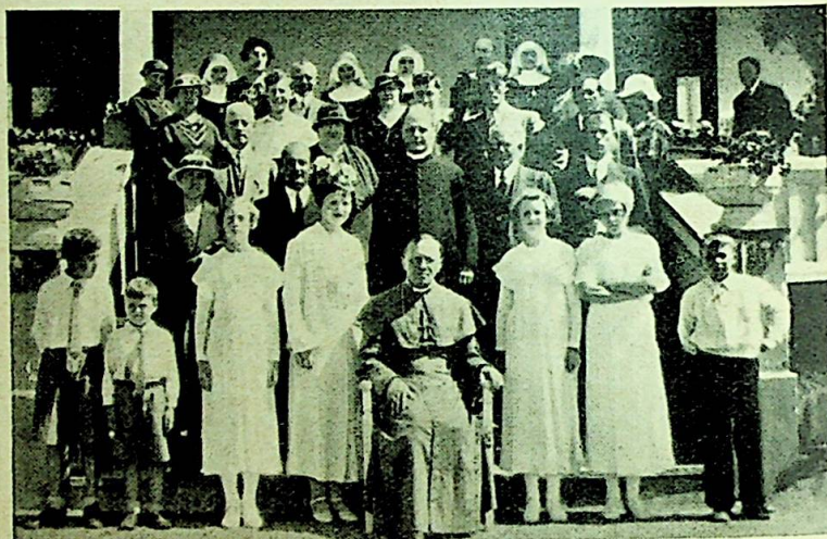
Fra Tønsberg 30te juni.