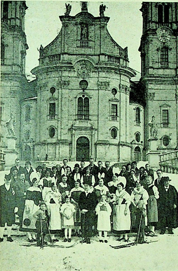
En gruppe med forskjellige nasjonaldrakter.

kirken, som er midtpartiet i det enorme klosterkompleks. Disse er landemerker og kan sees på flere mils avstand. Det stør-slagne og prektige Benediktinerkloster dominerer byen fullstendig, da det ligger helt oppe på høiden, isolert fra selve byen ved den store og imponerende plass foran klosterbygningen. Klostret og kirken er Einsiedeln selv, og byen vilde intet være uten klostret. Det kan trygt benevnes som et av de største og betydningsfulleste Benediktinerklostre i Europa; det står ikke under den Schweiziske kirkes kontroll, men sorterer direkte under paven i Rom, og flagget som vaier over klostret er det apostoliske pavelige korsflagg.