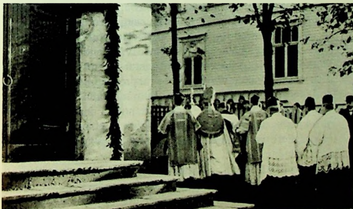
Fra kirkeinnvielsen i Haugesund. Prosesjonen.

Men denne beretning vilde være meget ufullstendig.