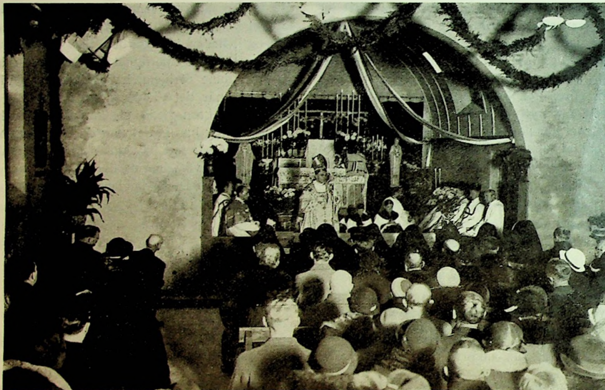
Fra kirkeinnvielsen i Haugesund.