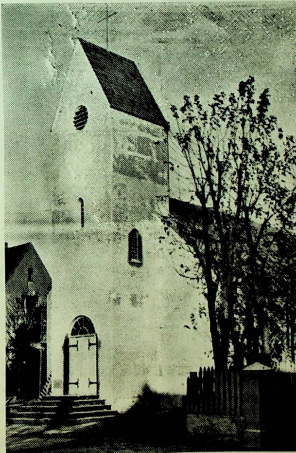
Haugesunds nye kirke.

Jeg har gledet mig . . . . . Endelig er den blitt til virkelighet min mangeårige drøm om å bygge på dette sted et lite, verdig Gudshus; endelig er de planer jeg i flere år har arbeidet med realisert og kirken står der verdig og herlig i all sin enkelhet. Vel var det mig under mitt virke her ikke forundt selv å realisere byggeplanene, da lydigheten