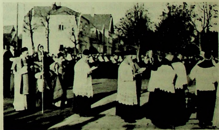
Fra kirkeinnvielsen i Haugesund. Procesjonen.