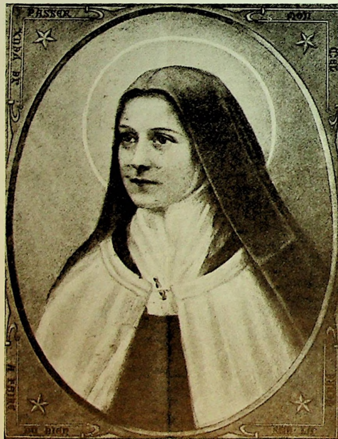
Terese av Lisieux, den «lille» Terese.

I sne og is og kulde, i ørken solens brand de gjør Guds lader fulle til høst for livets land.