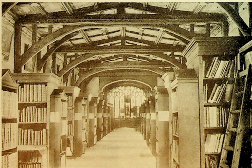
Bodleian Library, Oxford.

Han gjorde imidlertid ennu et siste forsøk på å redde