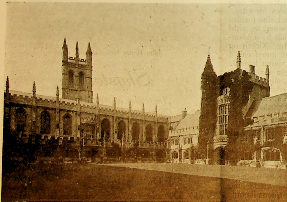
College i Oxford.

heters vokter mot liberalismens angrep — og særlig fremholdt Newman at det gjaldt å hevde den guddommelige åpenbarings evige gyldige sannheter mot de skiftende tiders nye systemer og teorier. Parlamentets lov om Catholic Emancipation, hvorved katolikkene i England opnådde de almindelige borgerlige og politiske rettigheter som var blitt berøvet dem fra reformasjonstidens dager, gav disse unge teologer i Oxford leilighet til å formulere sitt kirkesyn. De betraktet denne lov som et utslag av religiøs likegyldighet og reagerte følgelig sterkt imot dens vedtagelse og fikk derfor forhindret sir Robert Peels, ivrig forkjemper av Emancipation Bill, gjenvalg som representant for universitet i Oxford. I de følgende år arbeidet de liberale for den engelske statskirkes ophevelse og et skritt i denne retning blev gjort ved ophevelsen av de anglikanske bispedømmer i Irland. Det var våren 1833.