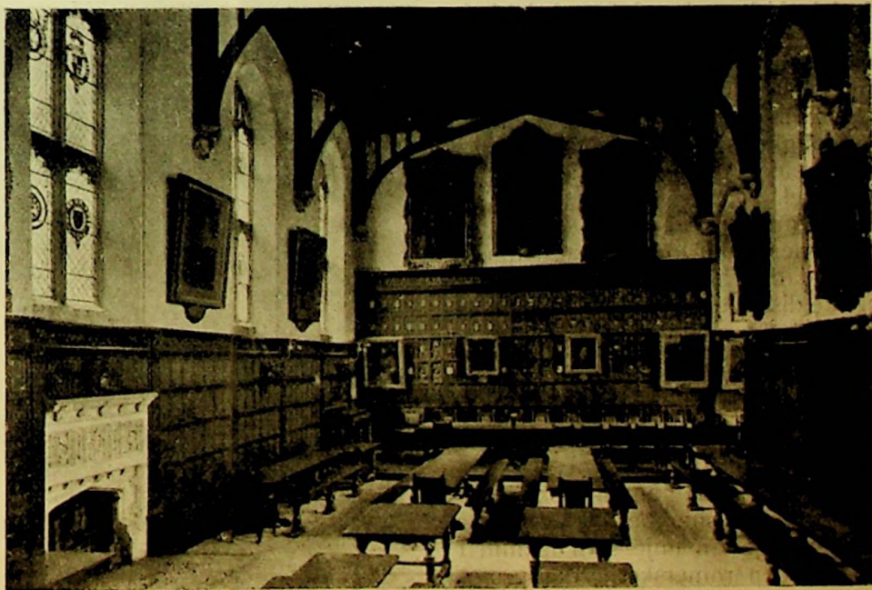
Spisestuen i et College i Oxford.