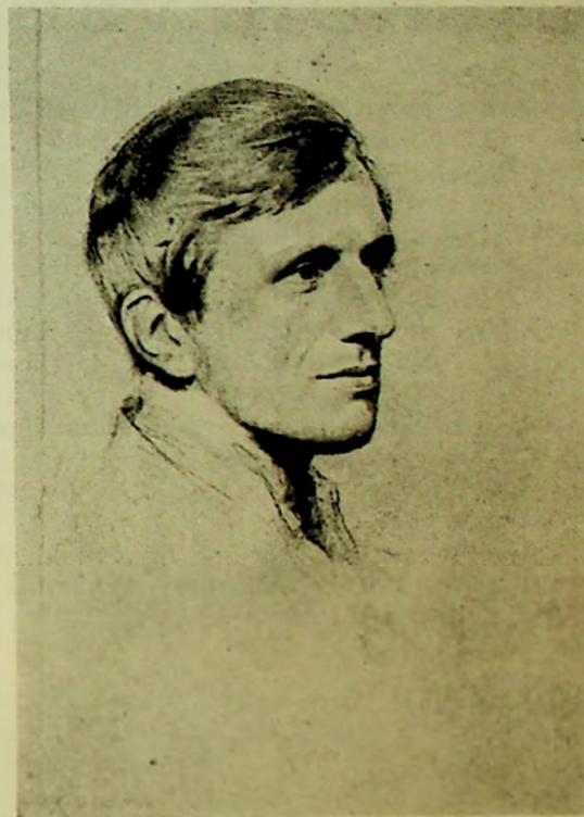
John Henry Newman som ung.

„har gjort skibbrudd i troen“. Dette vil særlig forekomme i en tid som vår. Katolikker går ut i verden, de kommer sammen med mennesker av alle slags trosbekjennelser; de hører alle slags sofistiske innvendinger mot Kirken, mot dens lære og bud. Hvad er det da som faktisk skal holde dem standhaftige i troen uten en personlig erkjennelse av deres eget behov for den? Hvad skal føre dem til Botens sakrament uten sorgen og avskyen for synd? Hvad skal bringe dem til kommunion uten tørst etter den levende og sanne Gud? Hvad skal være deres vern mot forstandens villfarelser uten hjertets dype overbevisning og ivrige higen?