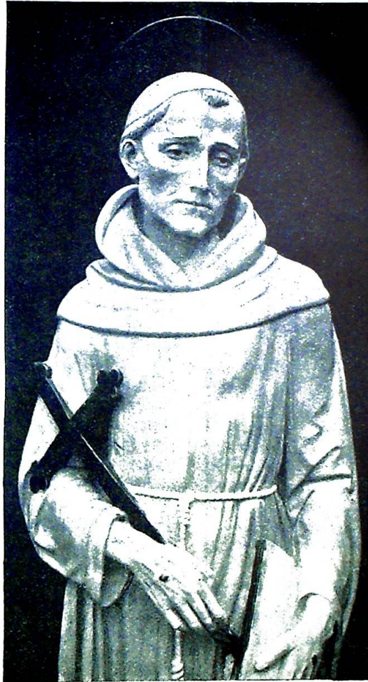
St. Franciskus med naglemerkene.

Da jeg igjen trådte ut av klosteret hadde sydens lumre varme sommernatt skjult alt i sin grå kåpe. Jeg skulde få bo hos munkene, d. v. s. i et hus lengere nede, som hørte til klosteret, og som var bestemt til å huse kvinnelig reisende, og på må få drev jeg ned en gressbakke med store trær hist og her, som lignet ut-