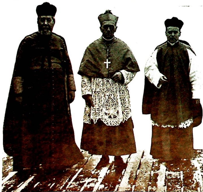
Da biskopen kom —.