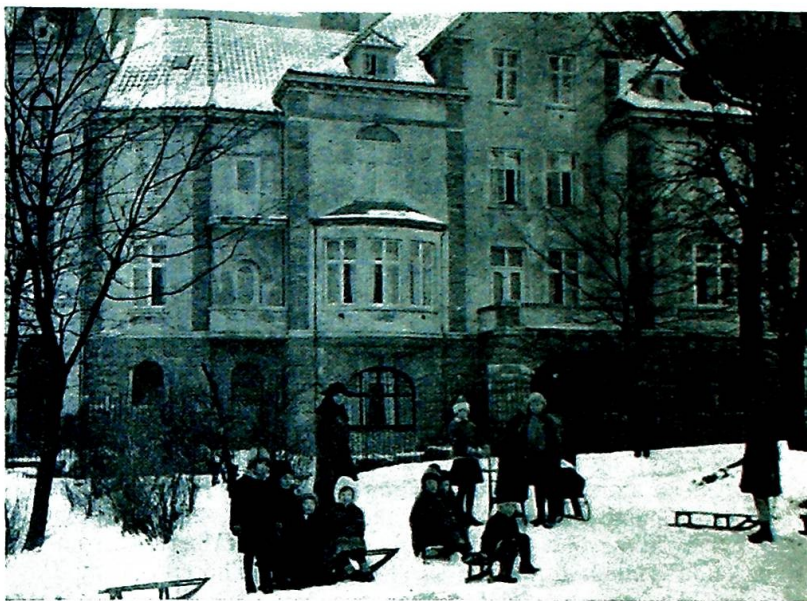
Øienklinikken i Bergen.

valgsprog: «Ut omnes unum sint» — «At alle må være ett». Heller ikke glemte han menighetens «øiesten»: skolen. Han opfordret alle til å fremme og støtte det store arbeide som menigheten med sognepresten i spissen dermed hadde begynt, og minnet igjen om at den som har ungdommen har fremtiden. Unødvendig å si at talen fikk velfortjent og stormende bifall.