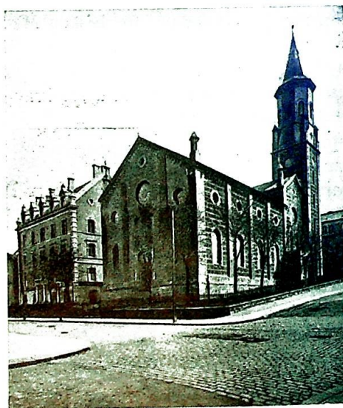
St. Pauls kirke og St. Franciskus' hospital i Bergen.