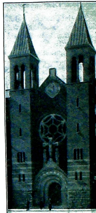
Sakramentskirken i Kjøbenhavn.

I, som til kongressen går, får «Lægedom for eders sår».