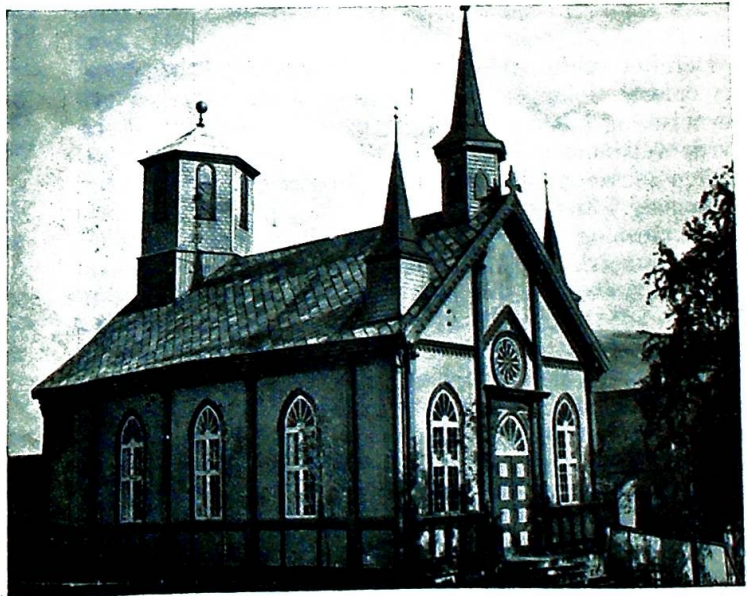
Vår Frue kirke i Tromsø.