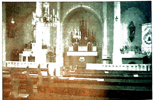
Interiør fra Vår Frue kirke i Tromsø.