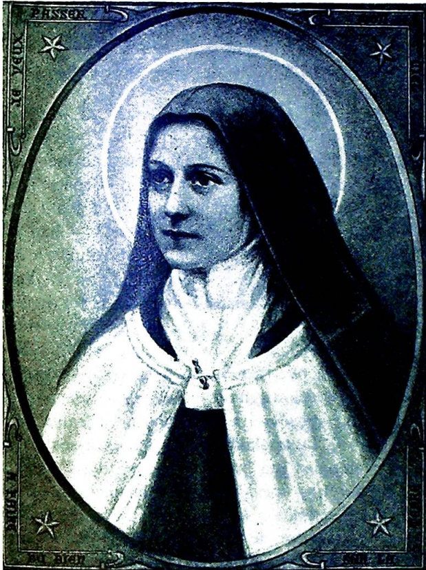
Therese av Jesu barnet.

Og som hun lærer at man skal utøve forsakelse igjennem hele livet, lærer hun også den stadige og kjærlige ydmykhet. Og hun sier akkurat som den spanske Therese, at det menneskelige mot er ikke tilstrekkelig når man ikke bare vil strebe etter å komme halvveis. Gud må forene sine handlinger med