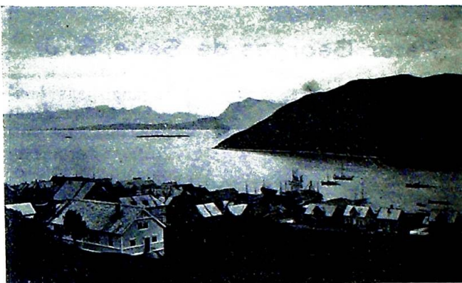
Harstad fra landsiden.

spredt utover dette areal, blir det dessverre ofte så, at enkelte, i stillings medfør eller på grunn av materielle interesser reiser utenom distriktet, og benytter da om mulig anledningen til å oppfylle sine kirkelige plikter, og følgen blir, at der kan gå år hen, uten de søker sin sognekirke. Blandt de her fastboende menighetslemmer er den første konvertitt av Harstads borgere. Det blev i sin tid fra fanatisk hold truet med, at den første av byens innvånere, som gikk over til den katolske kirke,