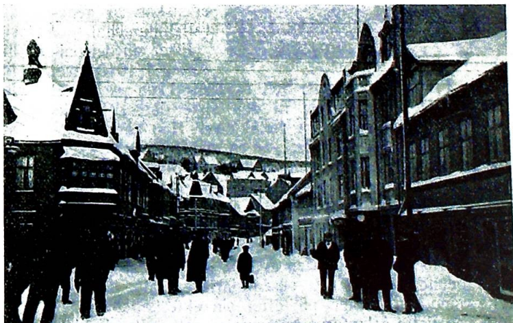
Hovedgaten i Harstad.

Så har vi St. Elisabethsøstrenes store og velsignelsesrike virke her. «De barmhjertige søstre» kalles de av mange, og det med rette. I sitt nye, velinnredede hospital pleier de syke og lidende med stor dyktighet og