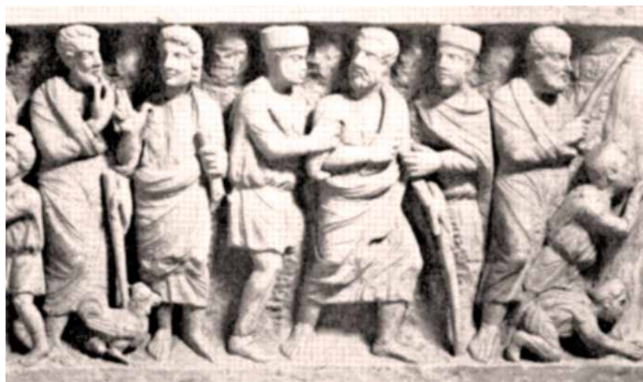
Mens relieffet i St. Olav kirke er et fragment, er «Den dogmatiske sarkofag» et velbevart eksempl på en sarkofag med motiver fra Peters liv.