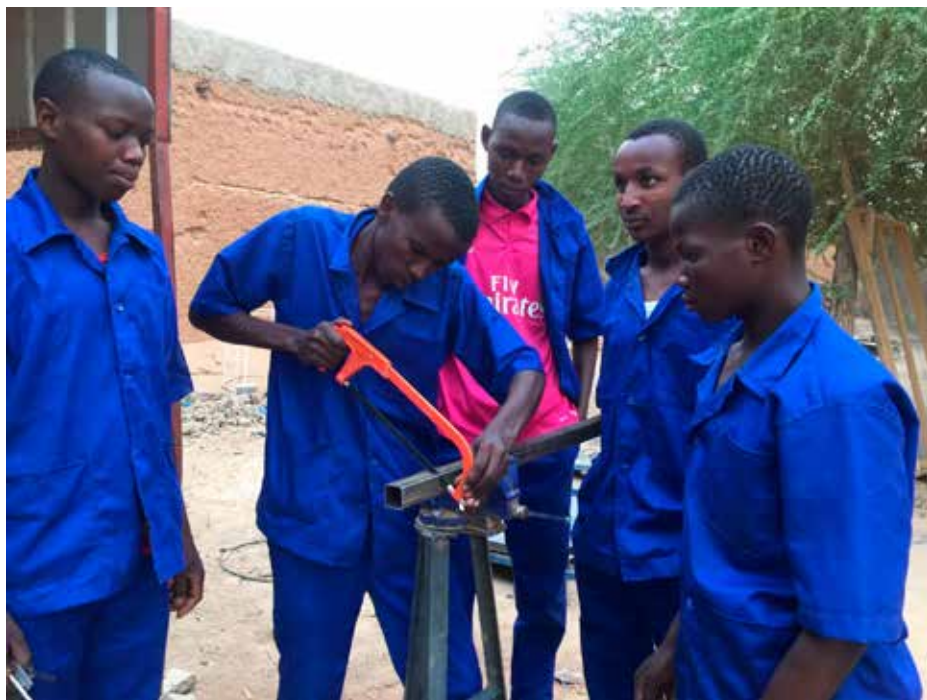
Yrkesopplæring gir bedre framtidssutsikter for unge menn i Agadez.

stadig oftere. Dette skaper store utfordringer i et område der landbruk er inntektskilden til de fleste som bor på landsbygda.