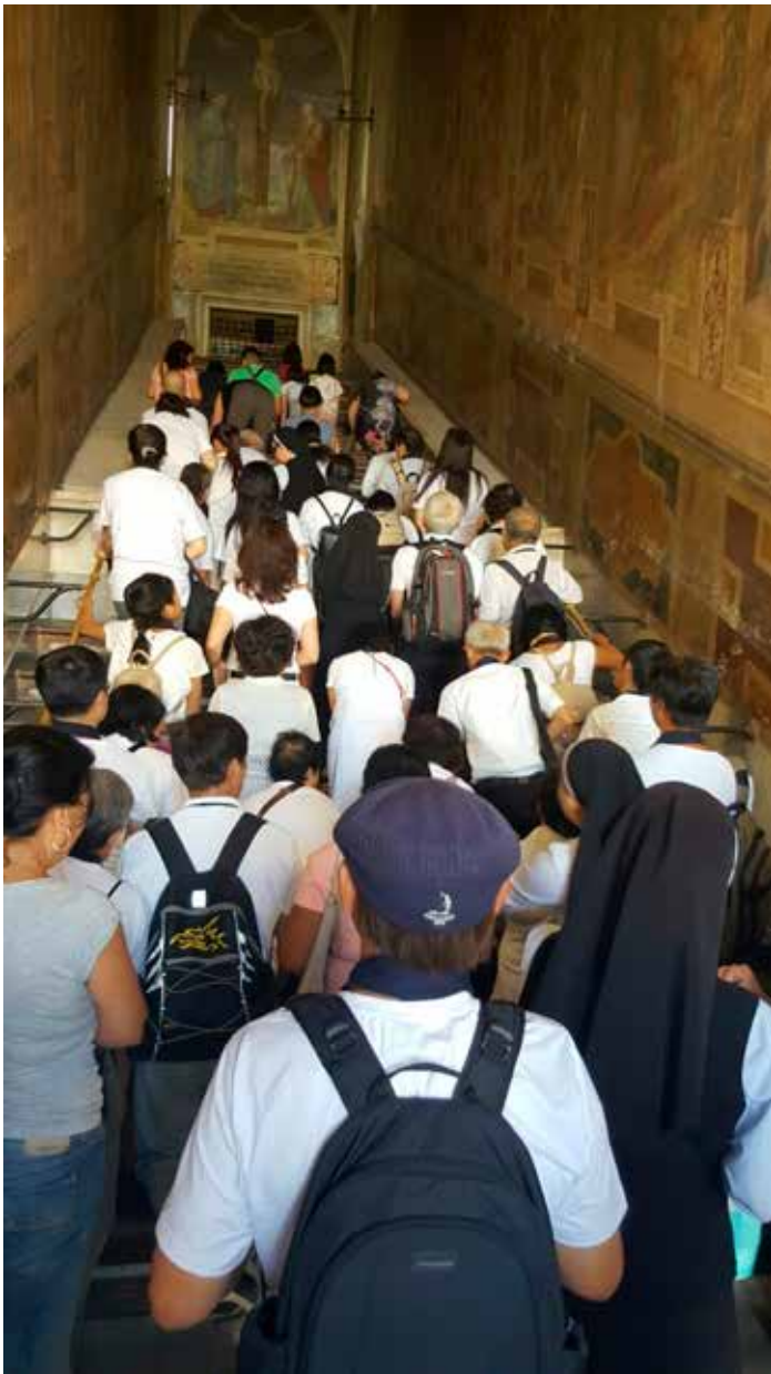
Pilegrimer på vei opp Scala Santa, «Den hellige trappen», under Vietnamisk pastoralsenters valfart til Roma nå i sommer.

et av barna føler seg urettferdig behandlet og dermed krever sin rett med vold, etter det gamle prinsippet «øye for øye og tann for tann». Behovet for