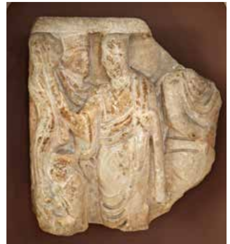
Fragmentet slik det fremstår i dag.

Nederst til venstre ser man to små menn som kneler for å drikke av vannstrålen. De bærer runde «kosakkluer» i skinn. En større mann med samme type lue står mellom klippen og hovedpersonen. Han bærer kjortel og en kappe som ligger i en bue over brystet. Dette er et paludamentum , en typisk militærkappe som viser at mannen er soldat. Ytterst til høyre ser vi en mann med samme slags kappe. Han vender