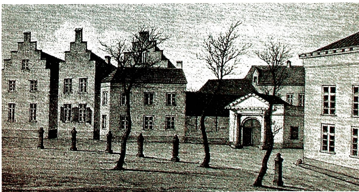
Eldste kjente bilde av "Het Deensche Hof", ca. 1850

I sin bok "Nogle bidrag til Christian 2.s historie under Landflyktigheden", utgitt i 1860