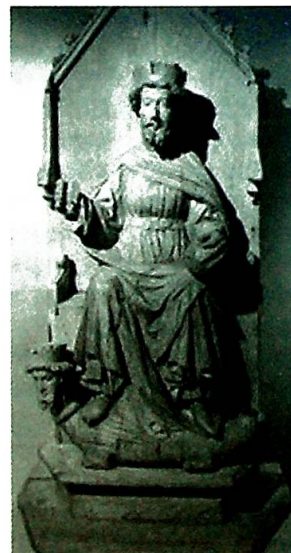
St Olav fra Austevoll kirke i Sunnhordland fra ca. 1450. Dragen med menneskehode som Olav trækker på symboliserer hedenskapen.

“En sky av vitner” omgir oss - troende mennesker som har levd før oss og nå tilhører den himmelske verden. Her er martyrer og bekjennere, mennesker fylt av Ånden som på en særlig måte fullbyrdet det nådens liv de hadde fått del i. St. Olav er en av dem. Men oss står han nær på en særlig måte. I hans liv inngår vår egen geografi - Ringerike, Moster, Stiklestad. Når vi vender oss til ham med bønn om hjelp i dagens strid, er det som til en av våre egne. Vi lever ennå av den frukt som vokste frem av hans død. Den Kirke han kjempet for, er hos oss med alle sine gaver og sitt løfte om frelse. Katolikker fra andre deler av verden som har funnet et hjem her hos oss, de er kommet til et land der Kirken