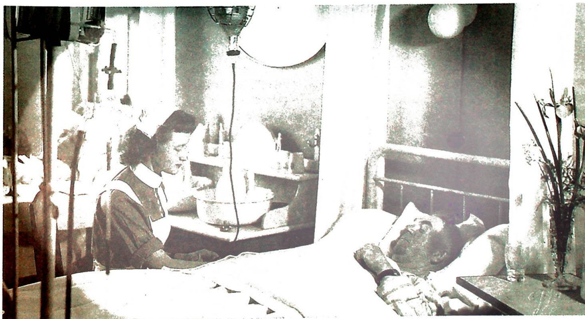
En elev har praksis på Vor Frue Hospital.