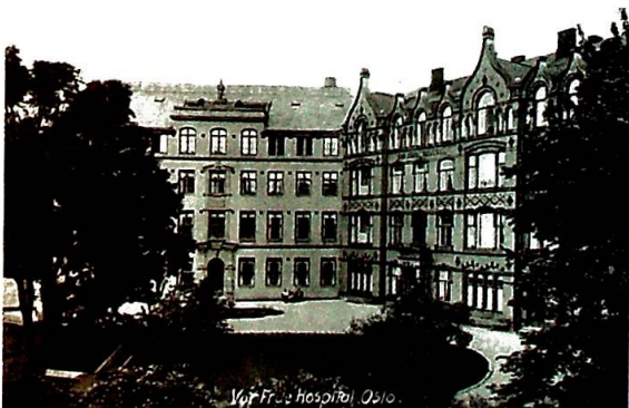
St. Josephs hospital, Oslo.

Våren 1857 ankom to franske damer Christiania med den hensikt å "forsøke en grunnleggelse". De to damene kom fra Stockholm, og var de første ordenssøstre i landet etter reformasjonen. Deres offisielle oppdrag var undervisning i den katolske skolen, og menighetsarbeid; bl.a. forskjønnelse av menighetens gudstjenester og trolig en viss karitativ virksomhet.