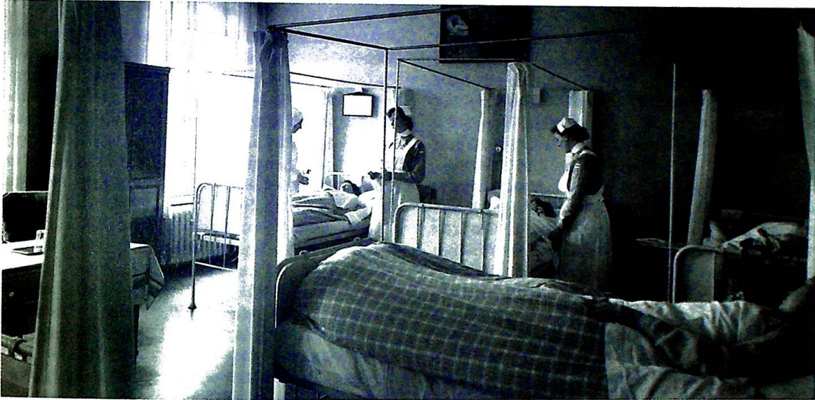
Elevene har praksis på Vor Frue Hospital.

teringer. Slik kunne en "ulydig" priorinne i Stavanger ekskommunisert – "bannlyst" – av biskopen, ikke bare suverent replisere med at hun anså straffen som en velsignelse fra oven, men også opplyse ham om at saken ville bli innberettet de kirkelige myndigheter i Roma. Det administrative talent middelalderens abbedisser måtte ha, levde i beste velgående på et 1800-tall som på mange måter var kvinneundertrykkende.