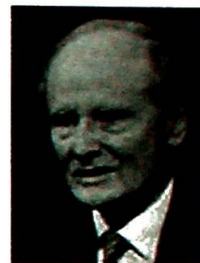
Christoph kardinal Schönborn (Erkebiskop i Wien) Robert Spaemann (em. prof. i filosofi)

man setter en latinsk bokstav i alfabetisk rekkefølge på hver halvtone, og hvis man deretter følger bokstaven til første tone i hver takt etter hverandre, oppdager man teksten: Ex Deo nascimur, in Christo morimur, per spiritum sanctum reviviscimus (vi blir født av Gud, i Kristus dør vi, og i Den hellige Ånd blir vi vekket til live igjen). I flere århundre har man beundret denne partitaen av Bach, og man har ikke savnet noe ved den. Men hvis man følger ryktet om at det finnes et skjult aspekt i denne musikken, oppdager man en helt annen dimensjon ved den.