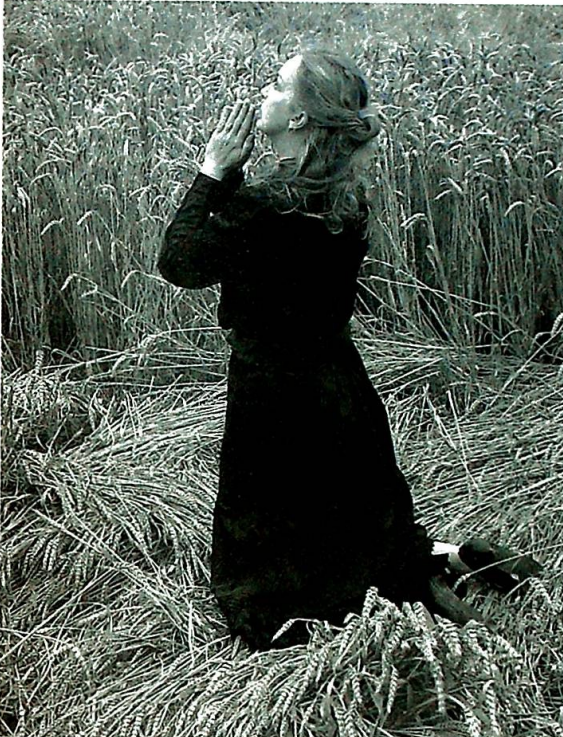
Stillbilde fra "Reflexions" 2005