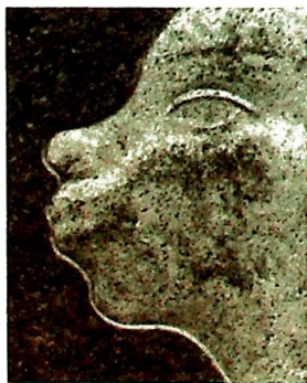
Detalj fra skulpturen «Møte» av Kjersti Wexelsen Goksøyr.

For disse sentenser – essenser, i kunstnerens øyne? – kan bli farlige, om de strekkes for langt og ikke gir plass for andre. Metallspisser stikker opp og ut av disse 'troskildene', man kan stikke seg til blods på dem: Det som skulle være en livgivende kilde og speile himmelens og jordens mangfold, er blitt kilde til lidelse! Urett skjer i sannhe-