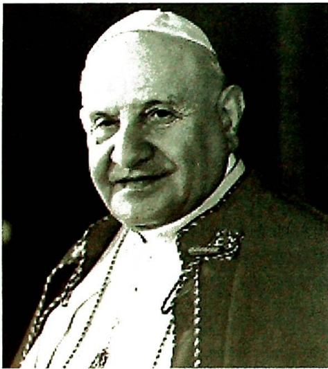
«Overgangspaven» Johannes XXIII var 77 år da han ble valgt til pave i 1958 – han ble den store fornyer. Han døde pinsefasten 1963 – i fjor vår ble han saligkåret.

Menneskelig sett var han sin forgjengers utsøkte kontrast. Pius XII var romer og aristokrat, en