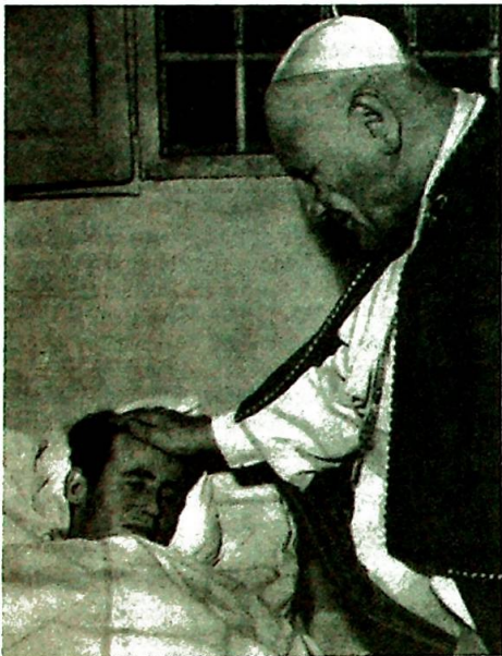
Johannes XXIII på besøk hos en syk fange i Roma.

gammel drøm, som lydigheten hadde skjøvet ut av hans liv, men som savnet hadde holdt levende i ham. Den livlige, utadvendte gamle erkebiskopen ble uhyre populær i en gammel, aristokratisk by som ellers ser de fremmede an.