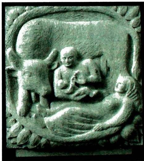
Et apropos til «den hellige Josefs dag» den 19. mars: Fjorårets julekrybbe i St. Helens kirken i Caerphilly i Wales.