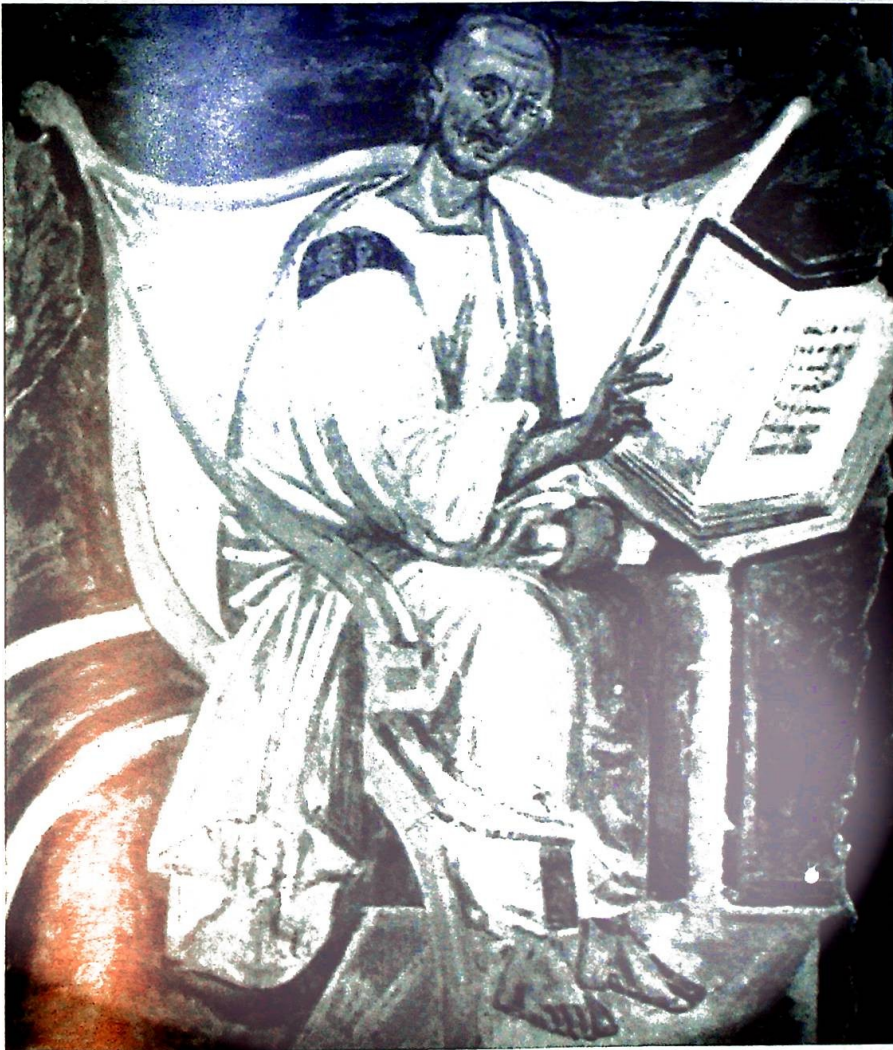
Fra boken: Det eldste portrett av Augustin, fra Lateranet i Roma fra midten av 500-tallet.

ring av selvets mange lag - alle tre lever som parasitter på en religiøst begrunnet tankestruktur, en oppfatning av selvet som Augustin setter til verden," (s. 165) skriver forfatteren. Og han lar oss videre møte et menneske av kjøtt og blod, og med