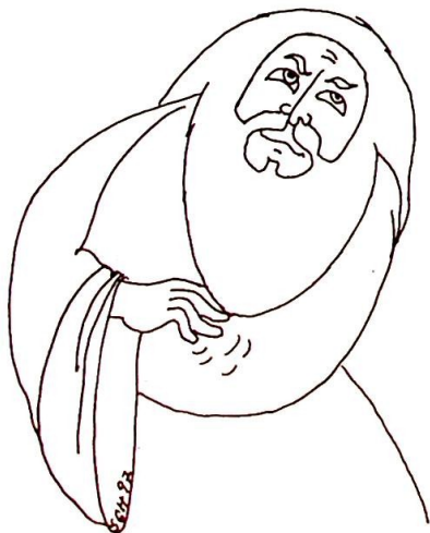
“Hellig krig? At de tør!”