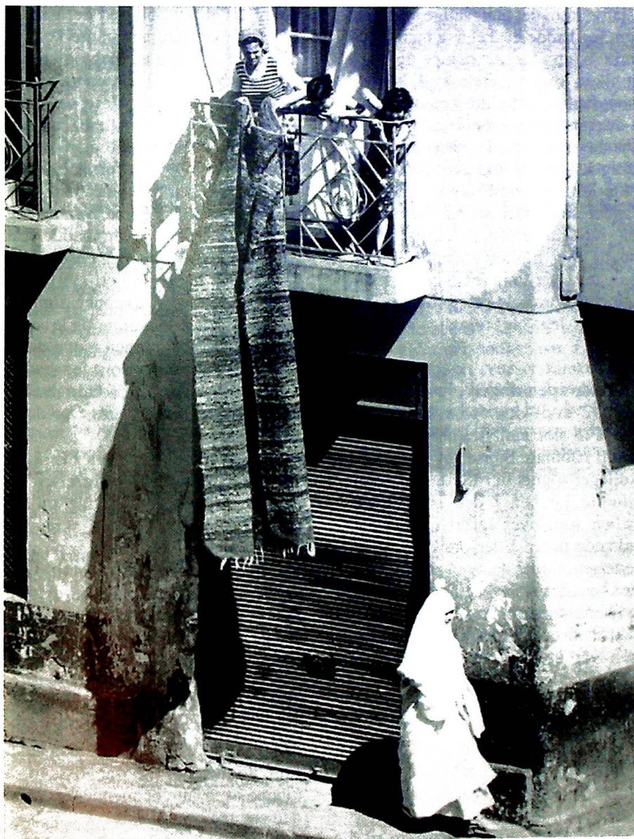
Gatescene fra Oran. Det sosiale nettverket i Algerie truer med å bryte på grunn av indre motsetninger og spenninger.