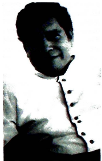
Carlos Belo er den første katolske biskop som har fått Nobels fredspris. 100.000 mennesker hyllet ham da han kom tilbake til Dili, Øst-Timors hovedstad, etter prisutdelingen i Oslo.

Derfor: Den Nobelpris som gis til en katolsk biskop, er ikke en hyllest til en enkeltperson, men en takk til og oppmuntring for den katolske kirke for dens engasjement opp gjennom århundrene til forsvar for og fremme av men-