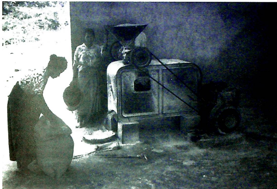
Utdannelse er investering i fremtiden. Bildet er fra et jordbrukskollektiv i regi av sale-sianerne, biskop Belos orden.

blomsten, blomstrer kun én gang i livet." La ikke blomsten visne på veien.