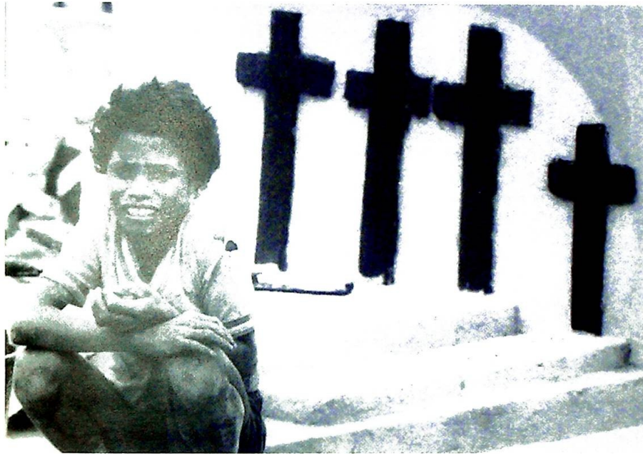
Mer enn 200.000 mennesker, en tredjedel av Øst-Timors befolkning, ble ofre for den indonesiske invasjonen i 1975.

Dalai Lama frykter at de nye tiltakene kan utløse voldelig motstand, noe han klart tar avstand fra. "Behandlingen av Tibets munk og nonner gir lite håp om at Kinas regjering legger vekt på å finne fornuftige løsninger for landets etniske og religiøse minoriteter," skriver bladet Christ in der Gegenwart . Som viser til økende spenning i forholdet til den islamske befolkning i Sentral-Asia.