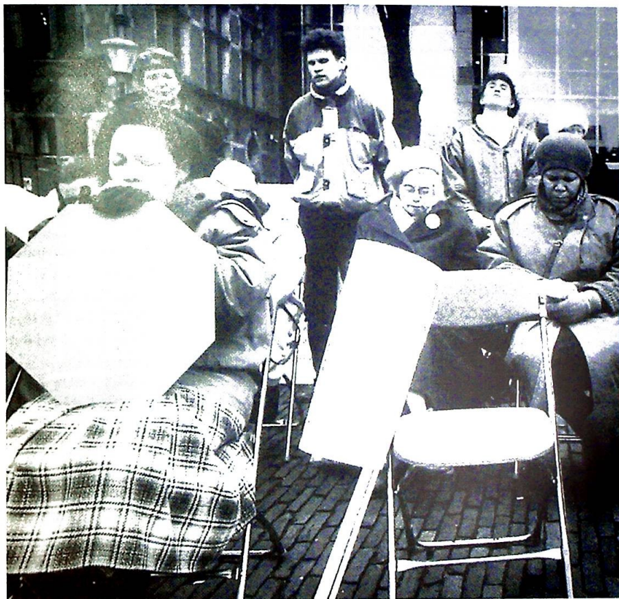
Amsterdam 1993: aksjon mot nederlandsk eutanasi-praksis.

Etikkens grunnlag - miljøkrise og menneskesyn - biologien som livsanskuelse - fosterdiagnostikkens dilemma - langtidsomsorgen i støpeskjeen - dødsriterier og organdonasjon.