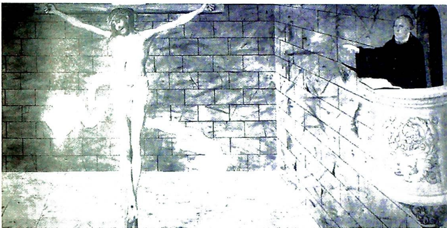
Luther på prekestolen. Fra altersokkelen til reformasjonalteret i Sankt Marien-Kirche i Wittemberg; malt av Lucas Cranach d.e. (1447).