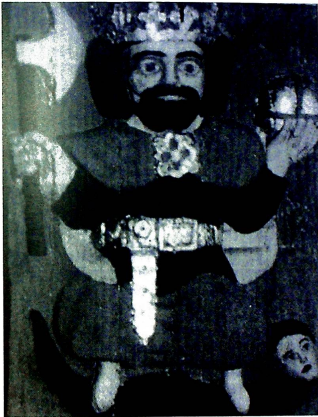
Illustrasjon fra boken: Bilde av St.Olav i Olavskirken i Tallinn, Estland.