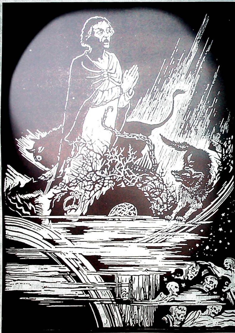
Draumkvedet - tresnitt av Olav Willums

Under kurset ble det åpnet en utstilling av tekstilseil som senere skal henge i Magnus-katedralen i Kirkwall. Kurset ble avsluttet med konsert i Nordens Hus og vesper i Olavskyrkja i Kirkjubø med kulturminister i den færøyske regjering, Bergur Jacobsen som liturg - kulturministeren er også prest.