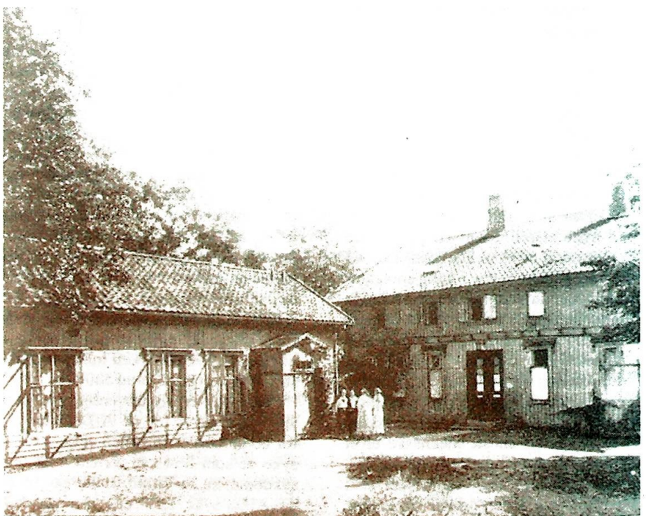
Sta. Katarinahjemmet anno 1933.

Det var smått stell med katolske miljøer i Norge på den tid, og antall katolikker var lavt. Folks uvitenhet om alt som angikk katolisismen, var utrolig, noe som fremgikk tydelig av den pågående diskusjon om jesuitterparagrafen. I en slik situasjon fylte miljøet på Katarinahjemmet et behov og savn, særlig for konvertitter. For dem som ble utsatt for motstand og press fra familie og omgangskrets på grunn av sin katolske tro, var det ekstra viktig å finne en slik oase. Her kunne man treffe trosfeller og få katolsk informasjon. De norske fikk sin horisont utvidet ved det franske innslaget, og de franske og