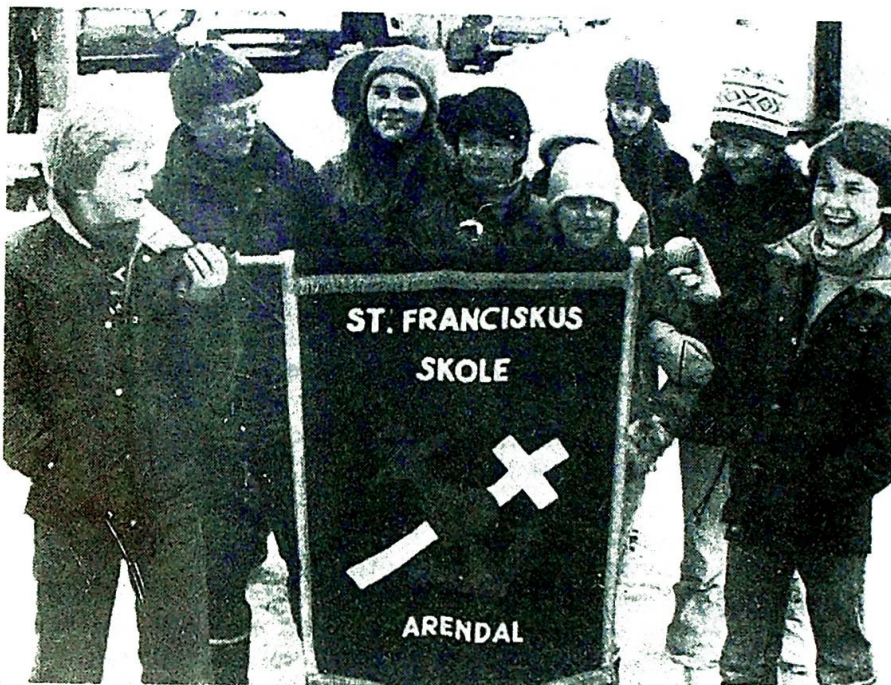
Glade barn fra St. Franciskus skole i Arendal.