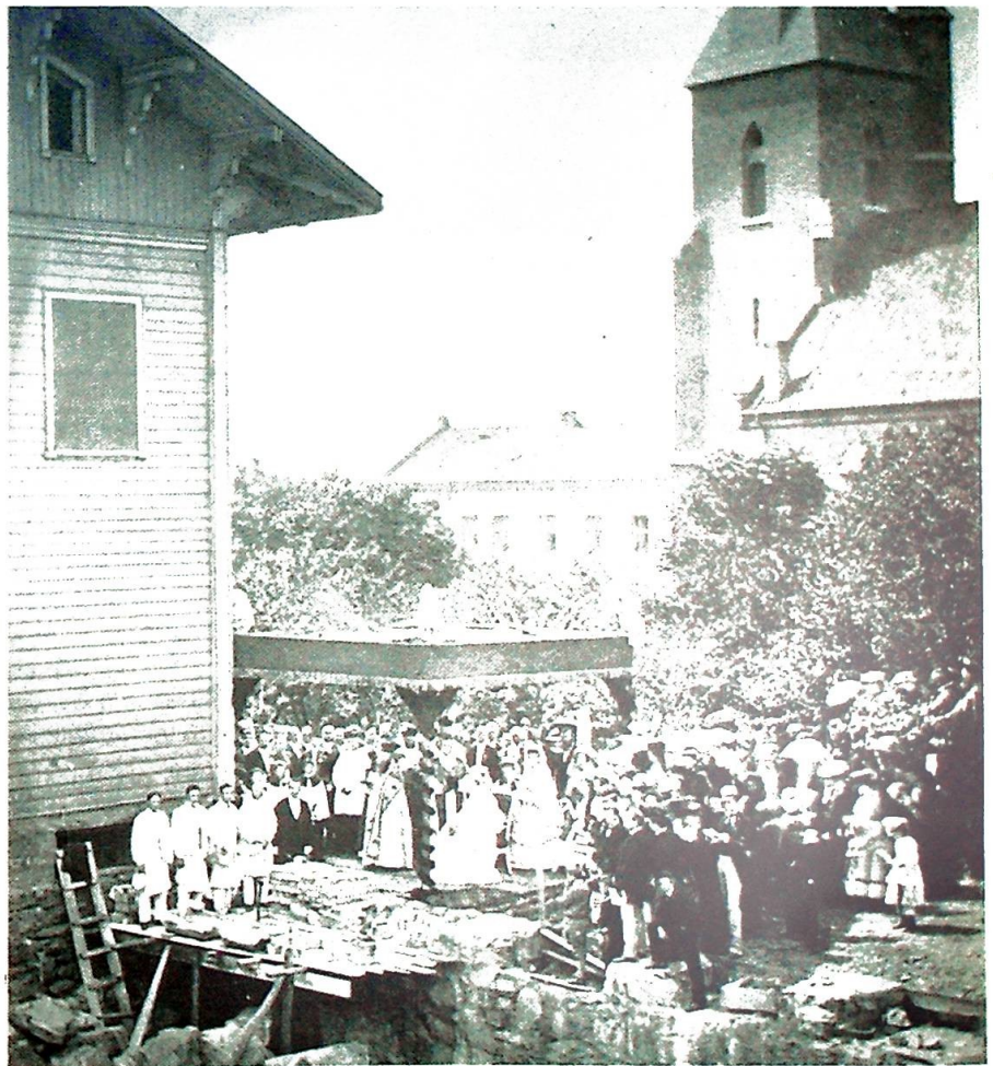
9. juli 1874: I nærvær av bl.a. enkedronning Josephine blir grunnstenen lagt til St. Josephs Institut, det som i dag er St. Sanniva Skole.

Privatskoleloven skal sikre et tilskudd som svarer til 85% av alle