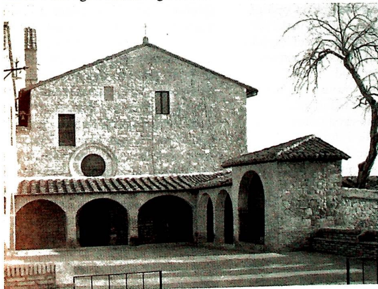
San Damiano i Assisi

Det mønster Gud skaper i vårt liv, har ingenting å gjøre med hva vi egentlig fortjener eller mener å oppnå ved å bli en mer eller mindre "perfekt" person. Enhver form for helliggjørelse i oss er Guds verk, og han kan forårsake endringer i oss som ligger langt unna det mønsteret