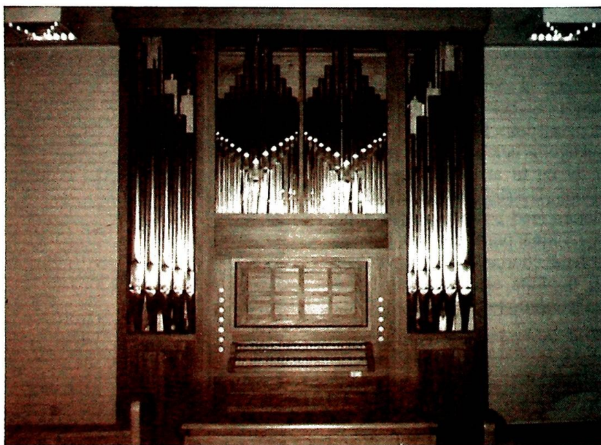
Det nye orgelet i St. Elisabethsøstrenes kapell på Nordstrand ved Oslo – innviet den 12. oktober, samme dag som søstrene feiret ordenens 150-årsjubileum.

Det er grunn til å gratulere Elisabethsøstrene med et nytt, praktfullt orgel som ikke bare vil være til ørens fryd, men som også har bidratt til en positiv opprustning av kirkerommet.