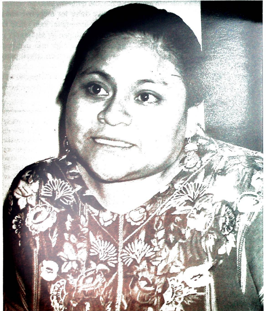
Rigoberta Menchú er oppvokst i en katolsk kirke som har tatt opp i seg mye av mayakulturen. "Jeg er maya-katolsk, men økumen," sier årets Fredsprisvinner.

- Vi hadde håpet at 1992 skulle bli FN's år for urbefolkninger, men det blir neste år i stedet, sier Rigoberta, som er glad for all den oppmerksomhet som rettes mot Latin-Amerika i 1992. - Det kan ikke sies ofte nok at for oss india-