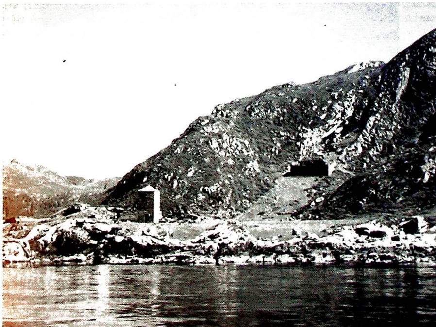
Klosterruinene på Selje - det lyse murverk mot den mørke berghammeren bakom er et sjømerke som kan ses langt til havs.

Hovedpunktene i legenden om "St. Sunniva og Seljemennene" - som er blant dem Sigrid Undset skriver om i sitt verk "Norske helgener" - er kjent for mange; et kort resymé kan likevel være på sin plass før vi trekker frem noen historiske data og annet stoff nettopp fra Undsets verk: Tiden er midten av det 10. århundre - Sunniva, datter av en irsk småkonge, nekter å gifte seg med en hedensk høvding fordi hun har lovet sitt liv til Gud. Sammen med et følge av trofaste menn og kvinner drar hun fra Irland, de tumler om på havet en tid, lander til sist på vestkysten av Norge, slår seg ned i en hule på den ubebodde øya Selje og bor der i lang tid, forteller den latinske "Acta Sanctorum in Selio". Folk inne på fastlandet får rede på nykommerne, tar dem for å være røvere og vil jage dem bort. Sunniva og folkene hennes flykter