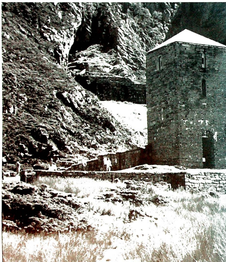
St. Albanstårnet, i bakgrunnen muren som dannet fundamentet for Sunniva-kirken - litt lenger oppe huleinngangen.

Ifølge legenden lot Olav bygge en kirke i fjellet utenfor Sunnivahelleren. For at det kunne skapes kirke-tomt midt i skredbanen, måtte to svære murer bygges tvers over uren, og på den øverste terrassen ble kirken reist. "Den var ganske liten, men omhyggelig og fint muret, som en kan se av ruinene," skriver Sigrud Undset. Og noterer videre: "Benene av Seljemennene ble lagt i store og små skrin, og det ble gjort en kiste til den hellige Sunnivas lik. Da den første inndeling av Norge i biskopsdømmer fant sted, ble Selja bolig for biskopen i Gulatingslagen, og han fikk sin gård og biskopskirke nede på sletten ved sjøen. I 1170 ble imidlertid biskopssetet flyttet til Bergen,