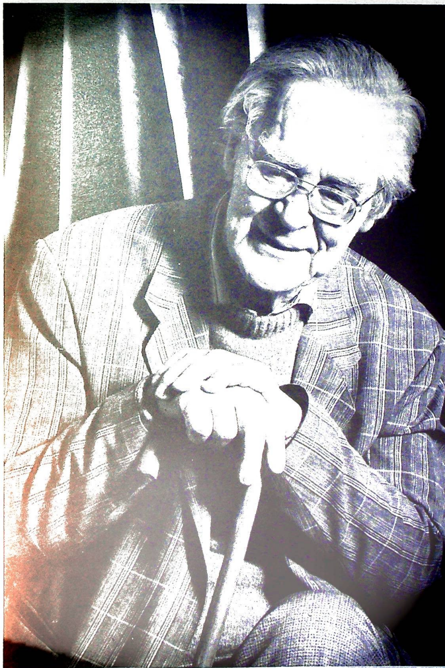
"Jeg er en slags sufflør, en som står ute i kulissene, som setter folk på ordene," sier lyrikeren Rolf Jacobsen som fyller 85 år den 8. mars.