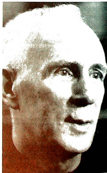
Henri de Lubac - ble avsatt som teologiprofessor, men fikk senere oppreisning.

"Om et menneske vil finne seg selv, må det søke høyere og lengre bort. Mennesket trenger noe bortenfor seg selv, noe som det aldri helt kan fatte; det trenger dette 'bortenfor', som alltid kommer til å forbli et bortenfor." (Henri de Lubac) (Fra «Katolsk Kyrkotidning») ●