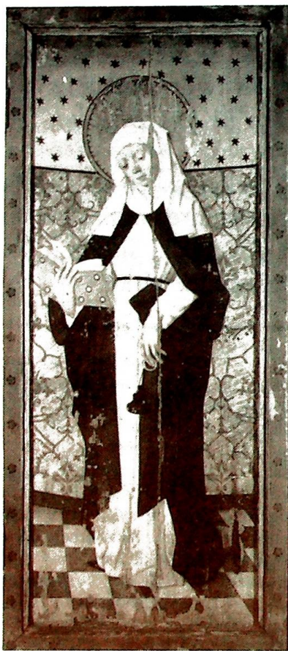
Den hellige Birgitta, maleri på et alterskap i Salerna kirke i Södermanland. Tilskrives kunstneren Herman Rode i Lübeck på 1480-tallet.

Et gjennomgående trekk ved Birgittas visjoner er hennes omsorg for menneskene. Hennes vesen, er det blitt sagt, var preget av mot og moderlighet. Hun regnes som en av