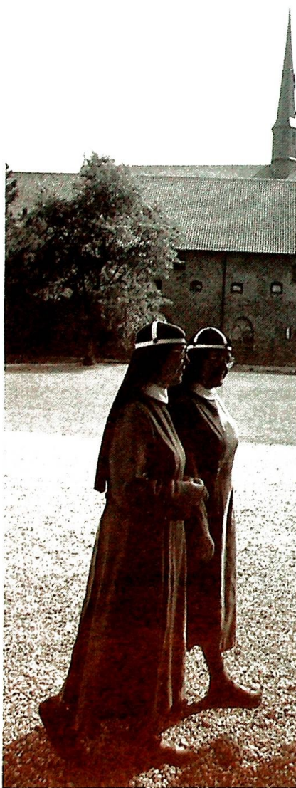
To av vår tids Birgittasøstre foran det gamle klosteret i Vadstena. I dag er klosteret museum. Også klosterkirken, bygget etter Birgittas anvisninger og innviet i 1430 - med en del senere forandringer - er bevart.

Middelalderens nonner i Vadstena levde et liv i arbeid og bønn. Hengivenhet for jomfru Maria var et markant trekk ved det birgittin-