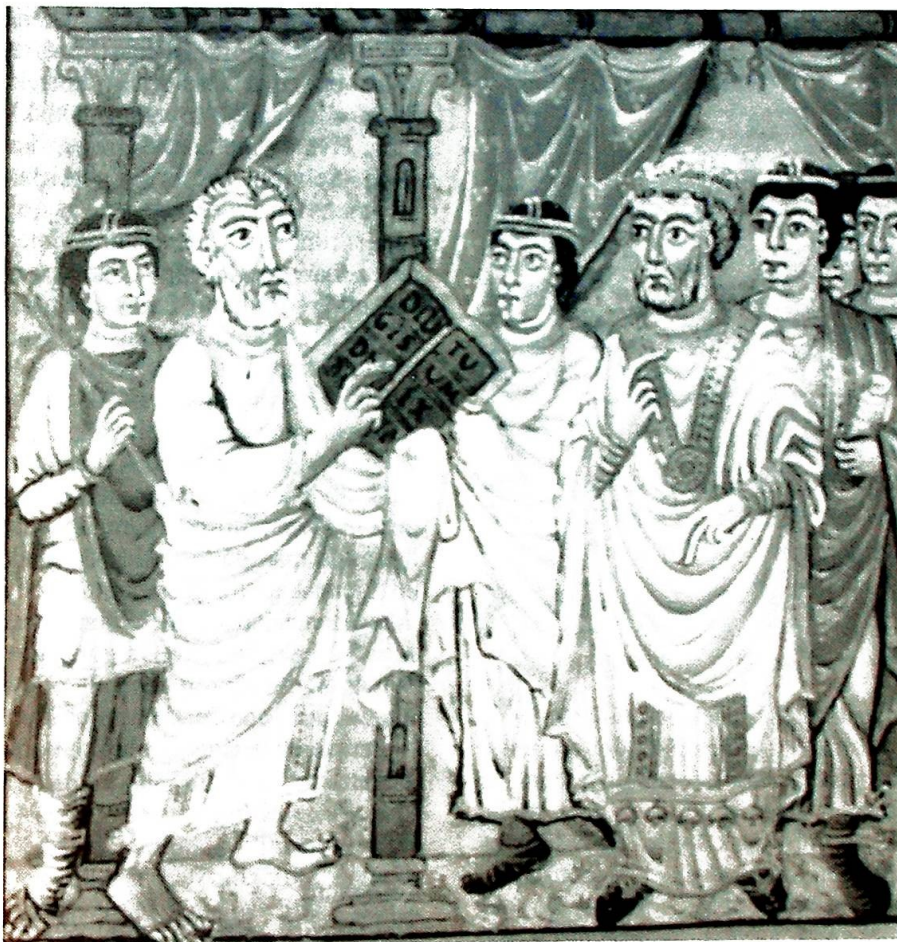
Karl den store - her med krone og kjede - var av større betydning for den gregorianske sang enn pave Gregor den store. Sammen med sin far, Pipin den lille, la Karl grunnlaget for en kulturell blomstring som resulterte i såvel den gregorianske sang som den senere utvikling av flerstemmigheten.

romerske melodier har en oppbygning og ornamentering som kan minne om bysantinsk kirkesang.