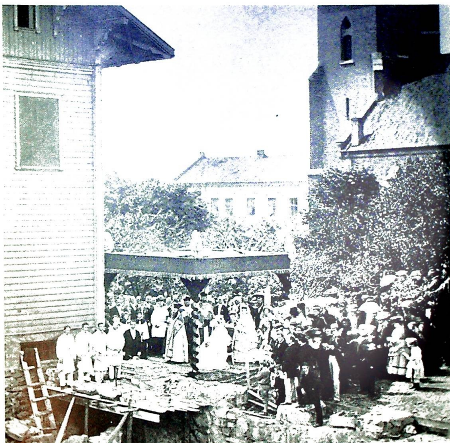
Enkedronning Josephine legger ned grunnsteinen til St. Josephs Institutt 9. juli 1874.