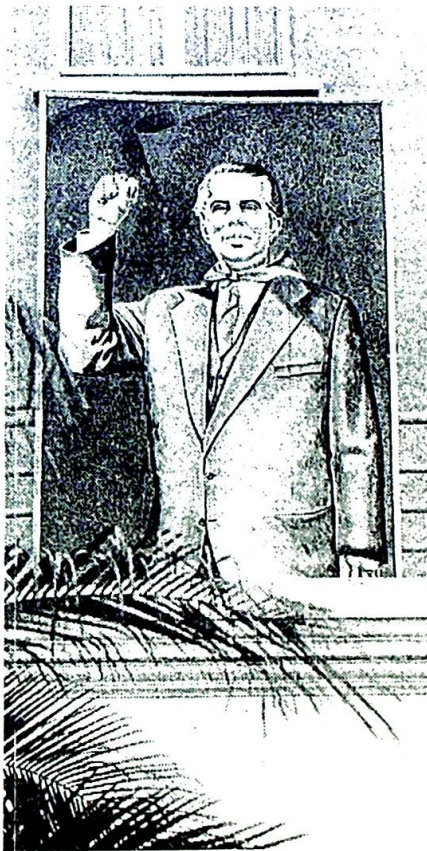
Fra verdenskrigens slutt til sin død i 1985 holdt Albanias diktator Enver Hoxha sine undersåtter i et jerngrep, og diktatorens bilde var å se overalt, i ulike posisjoner. Hans etterfølger Ramiz Alia har løsnet litt på grepet, men det er langt igjen...

Hvor meget den enkelte forstår av betydningen av de religiøse symboler og skikker, er en annen sak. Før krigen hørte Albania og Kossovo-provinsen i Jugoslavia til de mest primitive områder i Europa, med fjellområdene i nord som særlig tilbakeliggende. Ordensfolk arbeidet under forhold som nå ville bli karakterisert som "den tredje verden", for å få slutt på ættefeider og diverse hedenske skikker. Senest i år gikk katolske biskoper og muslimske ledere i Kossovo-provinsen, et område hvor det ikke har vært noen religionsforfølgelse,