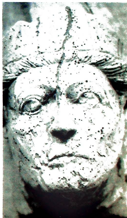
Et bispehode fra Vår Frues korportal i Nidarosdomen, laget på et tidspunkt som gjør det lov å spørre: Er det biskop Eystein Erlendsson?