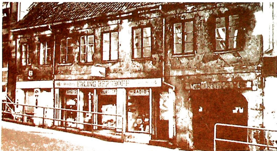
Teatergaten 4 i Oslo hvor St. Josephsøstrene åpnet sin første skole i 1865 – ved 100-årsjubileet i 1965 stod huset fremdeles, i dag raser Oslo-trafikken i tunnel der grunnmur og kjeller stod.

Og flyttet inn i det gamle to-etasjes murhus hvor de bare tolv dager