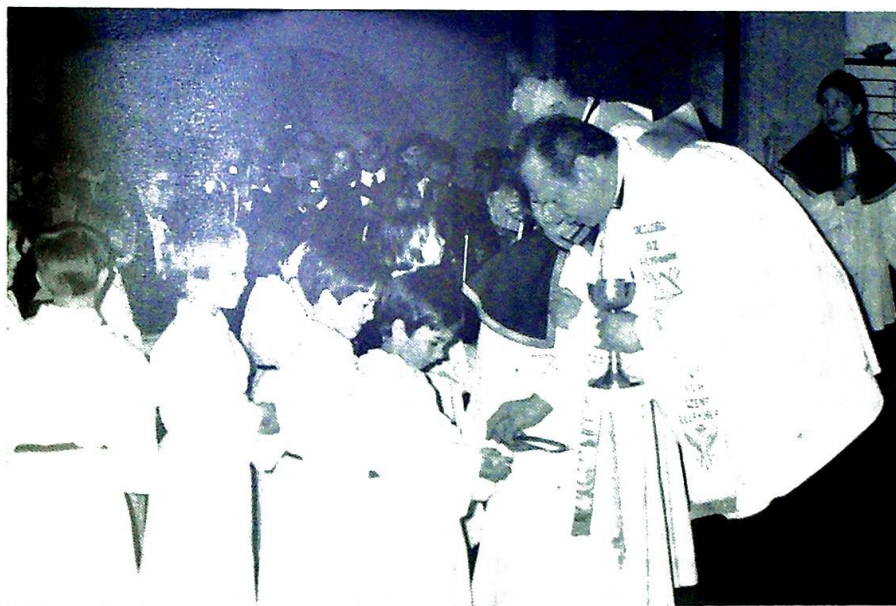
Det var trengsel under en 1. kommunion i menighetskirken til artikkelforfatterens vertskap i Buda. 1. kommunion ble avholdt i to puljer med hver 50 barn. Betyr dette et nytt håp for den katolske kirken i Ungarn?

ikke minst vi legfolk. Et katolsk akademi driver nå fjernundervisning for legfolk.