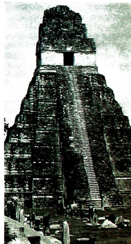
Forfedrene til dagens indianere i Guatemala, maya-indianerne, hadde en gang en bemerkelsesverdig høytstående kultur og sivilisasjon, som nådde sitt høydepunkt i perioden 200-900 e. Kr. Her et imponerende mayatempel.

evangelikale general Montt, ble krigføringen mot geriljaen intensivert. Hæren innledet et systematisk forsøk på å ødelegge den indianske kultur og de indianske folk. Indianerne, som utgjør majoriteten av innbyggerne, var, for å sitere general Montt, «gudløse og undergravende». Mens hans tropper raserte indianske landsbyer, ble preknene til denne gale evangelikale diktator hver søndag overført i fjernsyn eller radio, hvor han talte om rettferdigjørelsen og synden, om Sodoma og Gomorra og om den