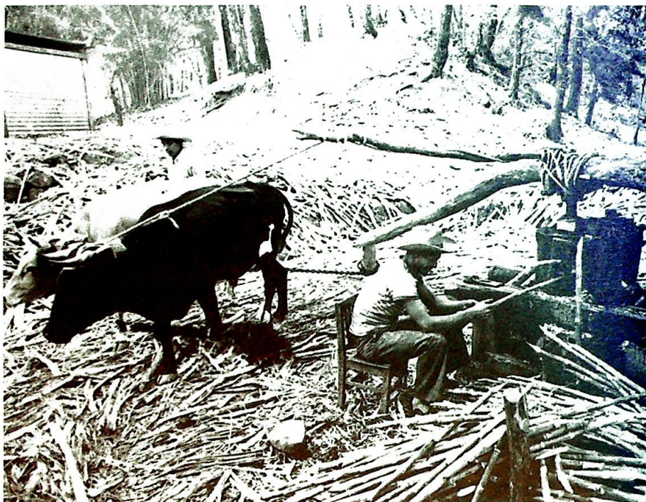
"Ropet om land er uten tvil det høyeste, det mest iherdige og desperate rop som runger i Guatemala." Slik innledes hyrdebrevet som slår til lyd for en jordreform i landet.

Det hersker likevel ikke mye tvil om at våpen blir sendt hemmelig til Guatemala, til tross for offisiell retorikk og dementier. I 1982 priste Reagan general Montt som «en mann av stor personlig integritet, med et brennende ønske om å innføre demokratiet». Samme år sendte USA 10 M-41 stridsvogner hemmelig til hæren i Guatemala, samt 23 helikoptre — som senere ble brukt i raids mot indianerlandsbyer for å massakrere innbyggerne. I mellomtiden har hæren i Guatemala vist sin takknemlighet ved å sende amerikanske våpen videre til con-