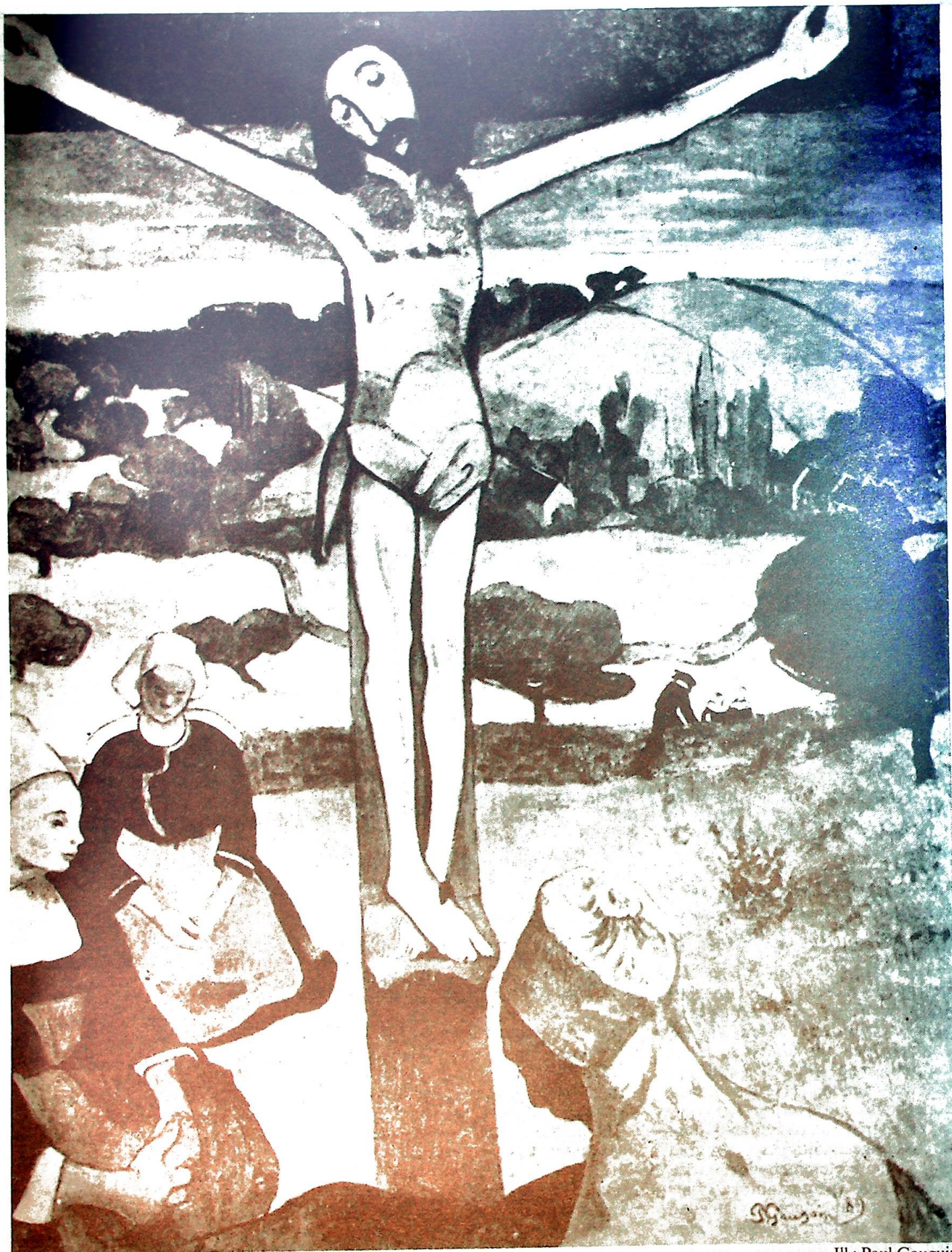
Ill.: Paul Gauguin

Ditt kors tilber vi, Herre, og din oppstandelse lovpriser vi, for se, ved korset er gleden kommet til verden.