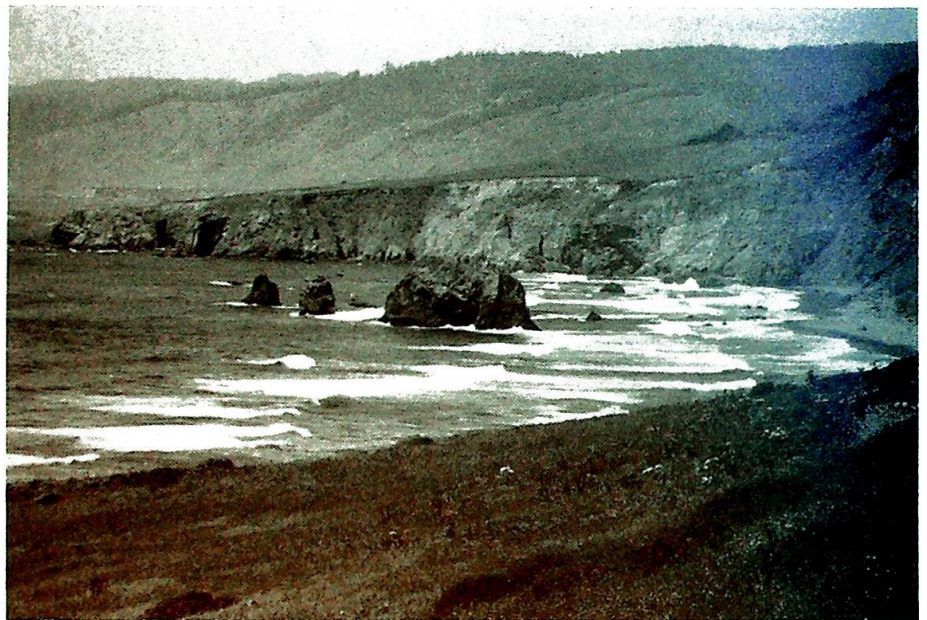
Californiakysten - nord for Mendocino.

California er dessuten et fantastisk land naturmessig. Fjell og hav og skoger der trærne sådde seg 400 år før Kristus. Et rikt dyreliv som lever