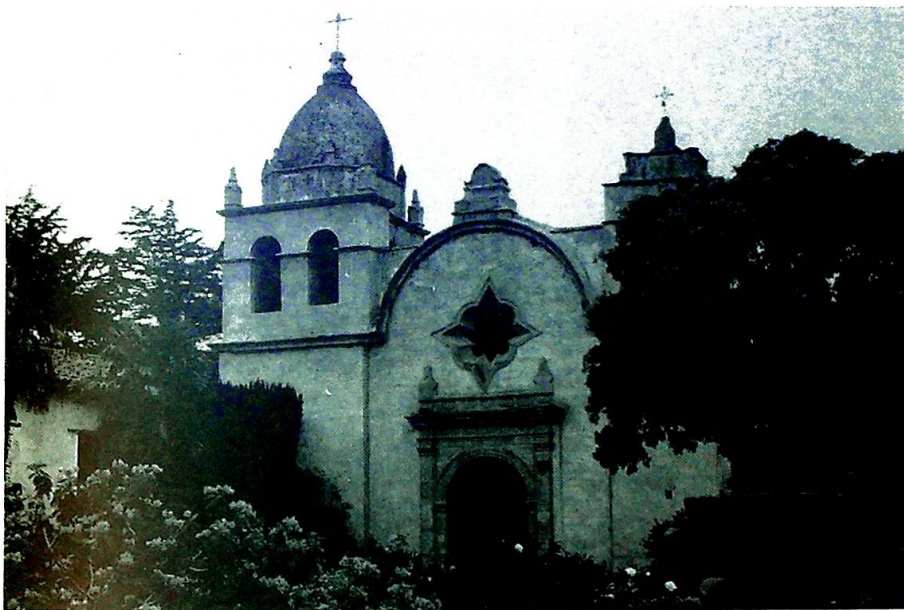
San Carlos Borromeo de Carmel (The Carmel Mission), grunnlagt i 1770 av Junipero Serra, restaurering påbegynt i 1934. Junipero Serra, som nylig ble saligkåret, er begravet her.

animerende foreleser som foresto en idrettslig såvel som intellektuell prestasjon på talerstolen.