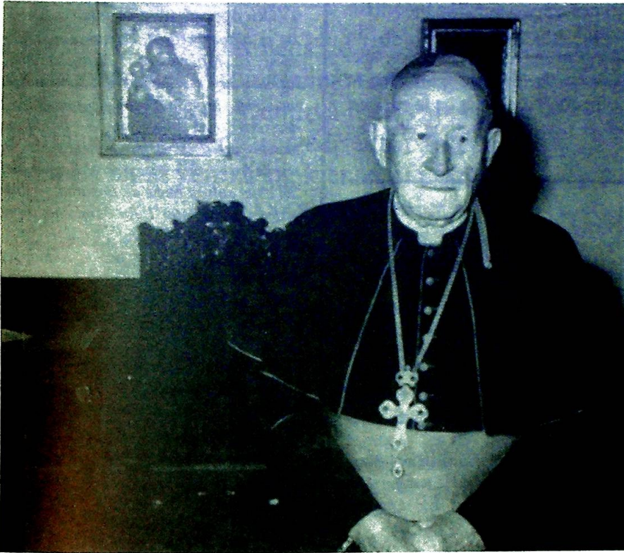
Den 89-årige kardinal Frantisek Tomasek er blitt et symbol på Kirkens voksende selvbevissthet i Tsjekkoslovakia. I de senere år er han blitt stadig mer frittalende overfor det anti-kirkelige regimet.

denne funksjon for våre vestlige venner. De føler på sin side behov for å hjelpe den tredje verden med all dens nød og fattigdom. Men det er fare for at våre vestlige venner søker etter kommunistiske løsninger. Vi kan personlig attestere hva det marxistiske system virkelig innebærer, og hvilke farer som skjuler seg i det. Det gjør vår rolle særdeles viktig – nettopp for den tredje verden.