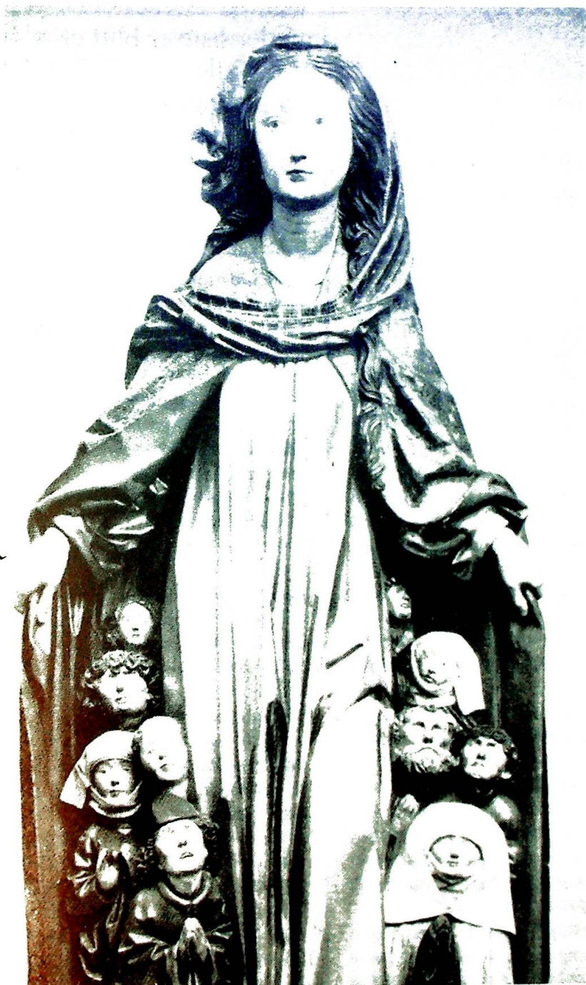
«Schützmantelmadonna» fra Ravensburg (1480).

Vi gav deg mange navn, vi tilbad ditt hellige hjerte. Ennå bæres ditt bilde frem, ennå lyser en stjerne på havets bunn.