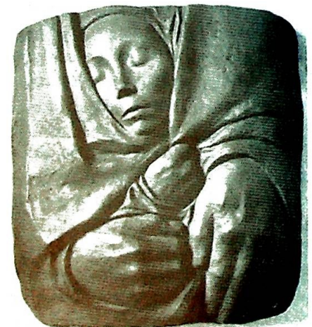
«Hvile i Guds hender» av Käthe Kollwitz.