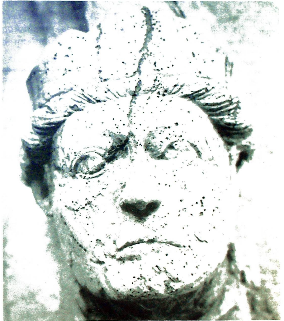
Kan det være erkebiskop Eystein Erlendsson? Et bispehode fra Vår Frues korportal, laget på en tid som gjør det lov å spørre.

Vi kjenner Øystein som kirkebygger, med sans for de nyeste trender i byggekunsten. Han skrev «Hellig Olavs liv og mirakler», som på sjarmerende vis gir oss et innblikk i tidens hverdagsliv, på et latin som vitner om litterær dannelse og røper studier i utlandet. Han synes å ha skapt et lærd miljø ved domkirken og sitt nyopprettede Helgester kloster. Men alt dette som grunnlag for reisingen av det som han sikkert så på som sitt åndelige byggverk, «kirken av levende stener».