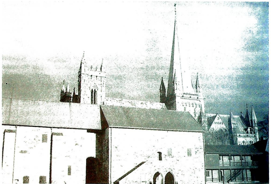
Erkebiskop Eystein var den store byggherre både for Erkebispegården og Domkirken. 800 år etter sin død er han nokså godt glemt..