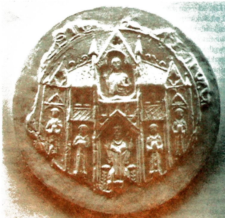
Nidaros Domkaptittels segl. Biskopen i midten omgitt av fire kanniker – overvåket av Kristus.

førere gjennom livet. Og trangten til å finne førere kan bli så sterk, der hvor den er blitt sulteforet og folkene avspist i det uendelige med verdiløse frihetsteorier, så folk etter folk står opp for å tilkjempe seg reell, personlig ufrihet, i håp om at et sånt offer må vel blidgjøre en ubarmhjertig Gud, eller en barmhjertig natur, eller en upersonlig utvikling, eller en eller annen irrasjonell faktor – så førerne skal bli skjenket dem. En del