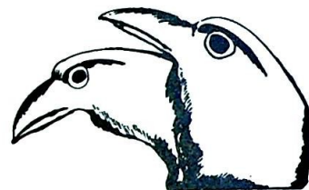
Hugin & Munin

Vårt Lands velkjente ravner, Hugin og Munin , meldte for en tid siden «at Drammen nå er landets best besøkte kirke. Man må stå meget tidlig opp for å sikre seg ståplass i St. Laurentius kirke, sitteplass er bare slikt menighetsmedlemmene kan drømme om. Dessverre er kirken katolsk, men likevel!»