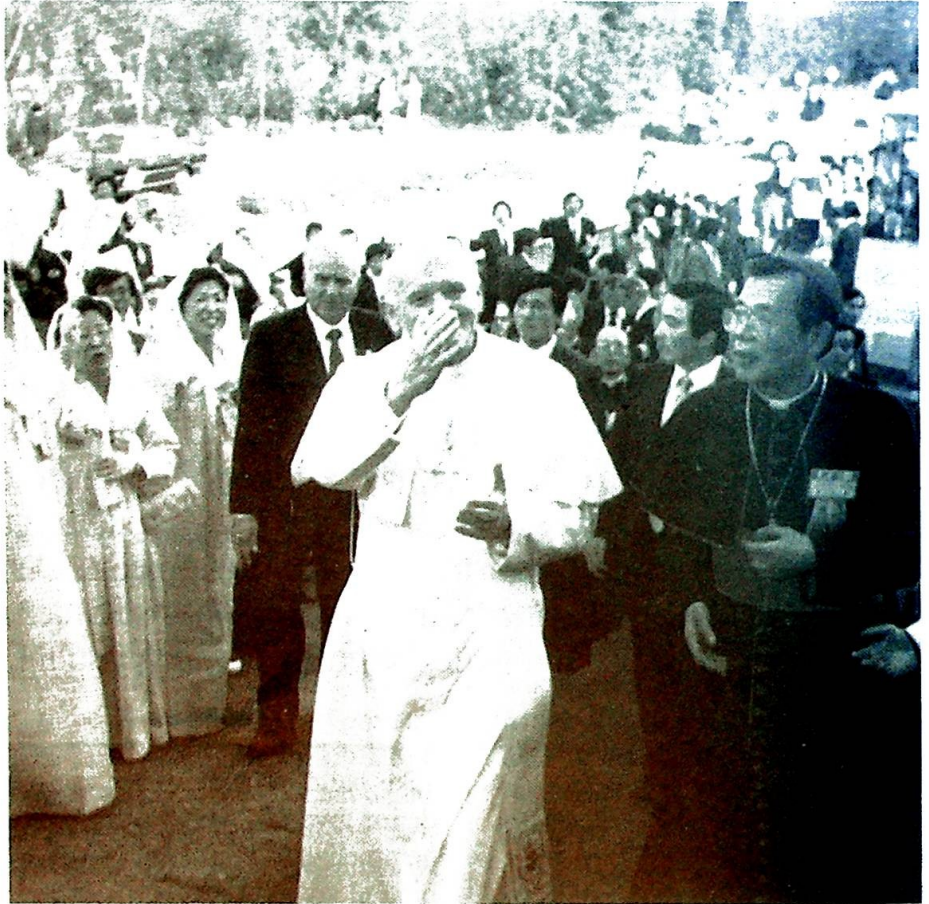
Paven og kardinal Kim under pavens besøk i Korea i 1984.

politikken.» Han minnet om at Det annet Vatikankonsil understreket Kirkens frihet til å felle moralske dommer i saker som har med politikk å gjøre. «Å gjøre det er ingen utidig innblanding i saker som ikke angår Kirken.» Men han oppfordret biskopene til å «forkaste og unngå vold og hat i Chile . . . Kirken støtter seg til sin egen arv av tro . . . som er mer enn sterk nok til å omdanne alt i Kristi ånd.» ORIGINS