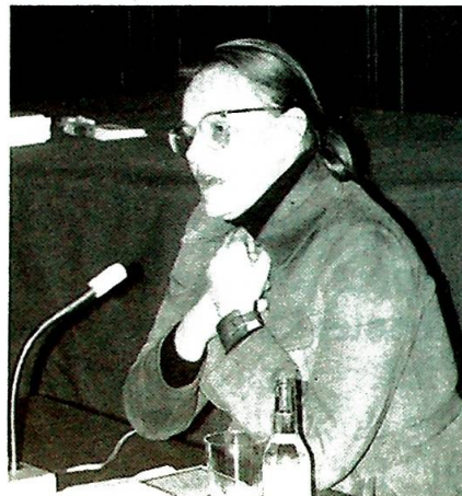
Vi var fra statens side bestemt til å vokse opp uten Gud . . . jeg var 26 år da Gud fant meg . . .

– Eksistensfilosofene som nå ble tilgjengelig lesning for oss, og som mange av oss begynte å oversette, ble inngangsporten til en ny virkelighetsforståelse, den sprengte den trange marxistiske determinisme vi var oppflasket med. Vi – og det betyr her mange, svært mange av min generasjon, – oppdaget både det frie valg og den åndelige dimen-