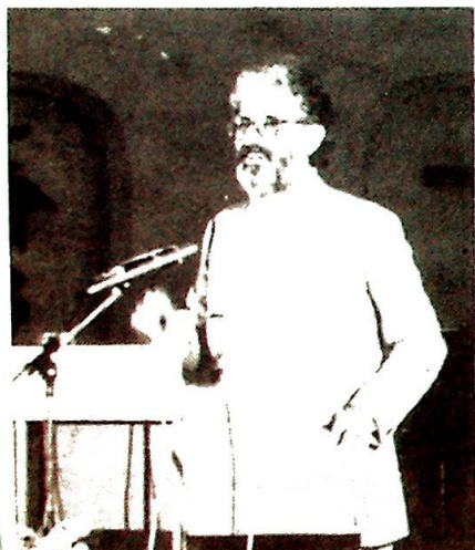
Pater Leonardo Boff i St. Jans kirke i Utrecht i sommer.

sismenighetene og i Amazonas-området, inntar som en selvfølge sin plass i Kirkens liv. De troende i disse menigheter sier at 'søstrenes messe' er mye mer hjertelig.» Selv er Boff meget konkret på dette punkt: Jo mer klerikal Kirken blir, desto mer blir kvinnene undertrykket. Det historiske åk, som er pålagt kvinnen, er en institusjonell synd i kirken. Man må hjelpe kirken til å omvende seg og til å frigjøre seg fra institusjonelle overgrep. Her ligger en ekstra oppgave for legfolk og for legmannssynoden i 1987: å gjøre kirken mer broderlig og søsterlig.