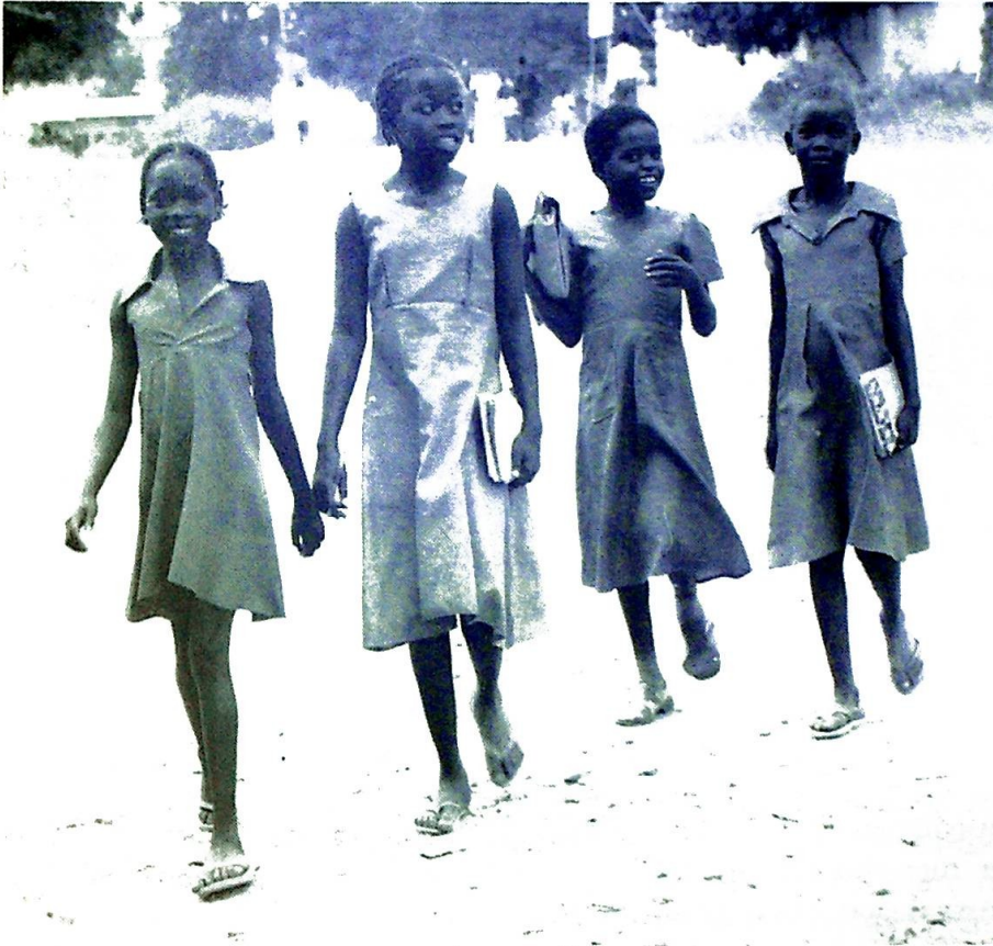
Bibelen åpen for alle.. også for skoleungdom i Sudan, et av de landene der bibelarbeidet har trange kår.

og tvangsflyttede har det vært ganske stor virksomhet. Et «bibelhus» i hovedstaden vil i det vesentlige bli finansiert av norske midler, nemlig av «Biskop Berggravs minnegave.»