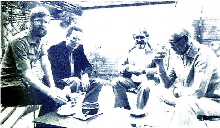
I samvær med medbrødre i fransiskanernes klosterhage i Utrecht utdypet pater Boff i sin uttalelse om «frigjøringens pave».

Noe av det viktigste, hevdes det i rapporten, er å bevege medlemmene ut fra komiterommene og ut på gatene. Kirken er altfor snever i sin bevegelsessfære og for bundet av gamle konvensjoner. Det finnes mange i ledende stillinger og med kirkelig tilhørighet som ikke har vært interessert i anti-rasisme, og Kirken burde utfordre dem til økt engasjement mot rasisme i lys av deres kristne grunnsyn. NØP