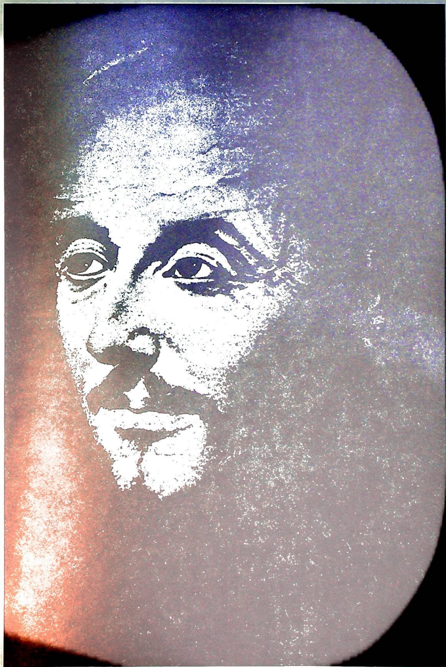
Ignatius av Loyola, reformpedagog fra 1500-tallet malt i 1585 (etter en ukjent dødsmaske) av Sanchez Corello, hoffmaler hos kong Filipp II av Spania.

med sin samvittighet. Med andre ord: skolen er en institusjon hvor unge mennesker gradvis lærer å åpne seg for livet slik det er, og hvor de lærer å skape en spesiell holdning inne i seg selv til livet slik det burde være . . . En skole er ikke bare et sted hvor man kan velge mellom ulike intellektuelle verdier, men et sted hvor man stilles overfor et spekter av verdier som leveres her og nå,» heter det i The Catholic School.