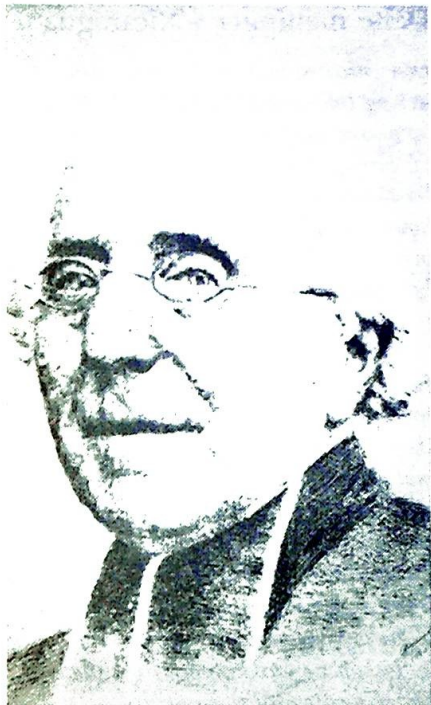
Pater Jean Claude Colin – grunnleggeren av Maristkongregasjonen.