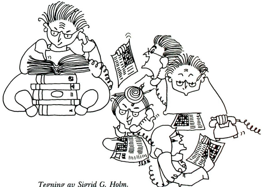
Tegning av Sigrud G. Holm.

Og alt dette takket være Hormisdas. p. Funderius