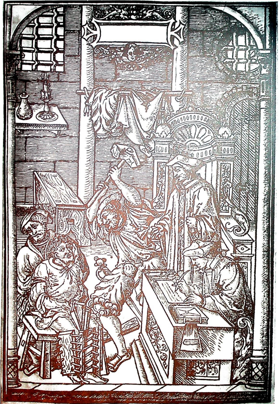
«Baksidebildet» til «Katarer og katolikker» – et middelalderstikk som taler for seg selv.