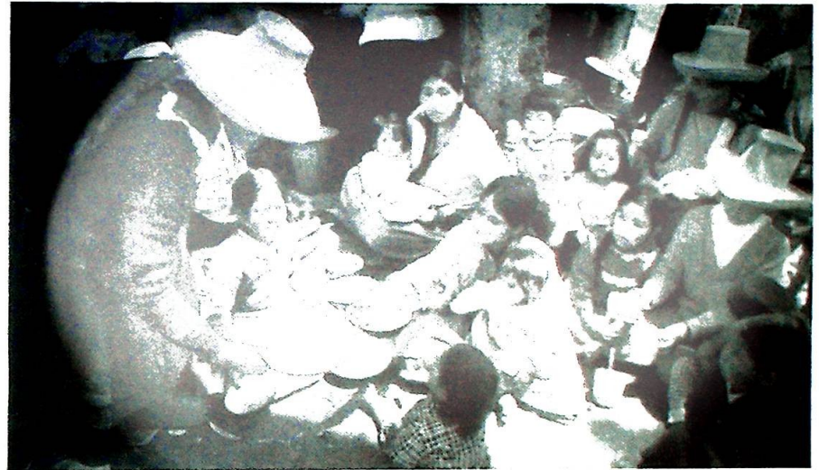
De urettferdige samfunnsstrukturene i Latin-Amerika er en stor utfordring, og siden 1906–70 årene har den katolske kirke i denne del av verden gjort de underpriviligertes sak til sin. Her deles det ut mat til trengende i Peru.

Et moment av nyere dato er den ideologiske styring kombinert med stor materiell støtte fra innflytelsesrike konservative og fundamentalistiske kretser i USA. Størstedelen av sektens tildels temme-