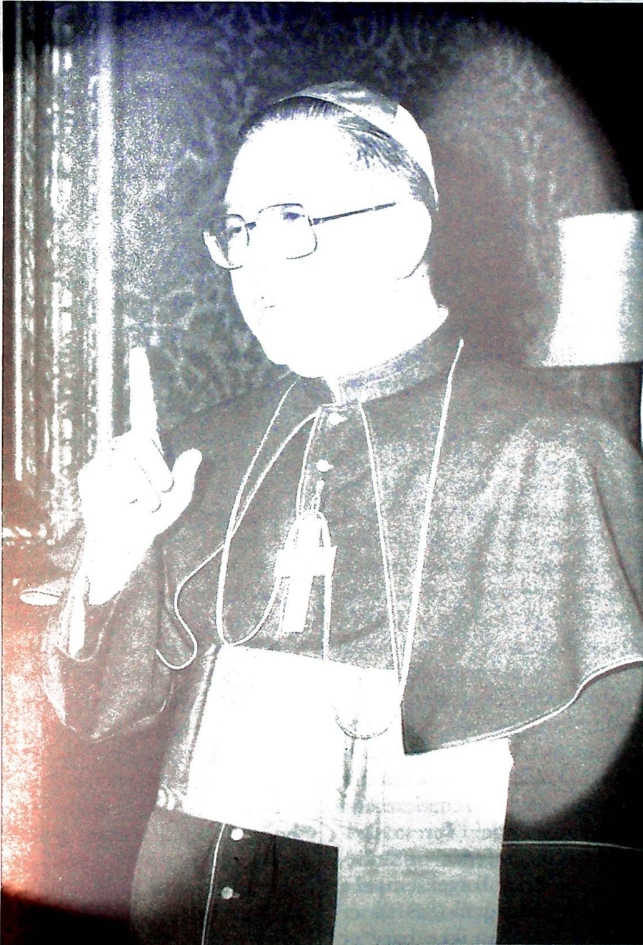
Erkebiskopen av Manila, kardinal Jaime Sin, hadde litt av hvert på hjertet da han møtte pressen under sitt besøk i London i våres.