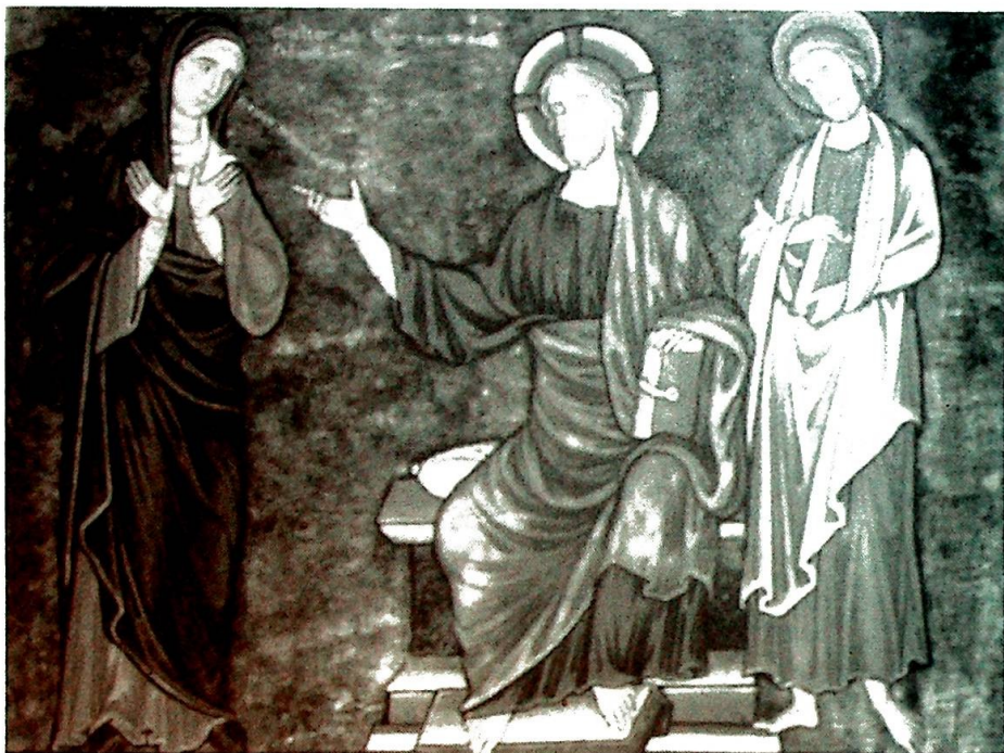
«Heller ikke jeg fordømmer deg. Gå bare hjem, men fra nå av, synd ikke mer» (Joh. 8, 11). Fra dronning Ingeborgs psalter fra 1200-tallet.

Hvis vi mener det alvorlig med å tiltrekke folk til Kirken, bør vi være oppmerksomme på at de trenger oppmuntring, så vel som veiledning. Det er mulig å knuse den menneskelige ånd ved en holdning som synes å mangle barmhjertighet. Kirkens dokumenter og vår stillingtagen har kanskje til hensikt å få de troende på rett kjørl, men de fører ofte til at folk trekker seg, at de blir drevet bort.