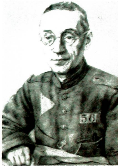
Titus Brandsma i fengselet i Amersfoort i 1942 — tegnet av en medfange.

Dette er i korte trekk Titus Brandsmas skjebne som han hadde til felles med tusenvis av andre fanger. Likevel ble det allerede kort etter krigen satt i gang en aksjon for å få ham saligkåret. Det var spesielt hans