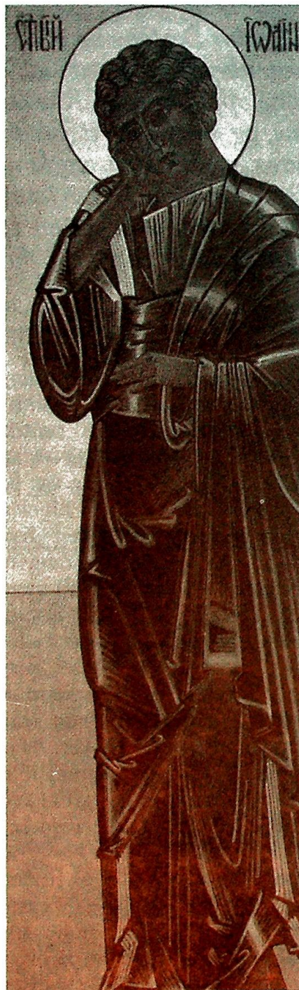
Johannes – kjærlighetens apostel.

Med disse reservasjonene i bakhodet er det likevel forbau-sende hvor mye dette materialet kan si oss. Dostojevskijs notater er for det første ikke likelig fordelt over alle Ny-testamentets bøker. De danner et bestemt mønster. Mens en gjennomsnittlig norsk (luthersk) bibelleser gjerne vil sitte bøyd over Romerbrevets 6 første kapitler, som inneholder den mest systematiske fremstilling av den paulinske frelses-teologi, har Dostojevskij her bare 2 anmerkninger. Også de synoptiske evangeliene ser ut til å være relativt lite lest. Til gjengjeld har Det fjerde evan-