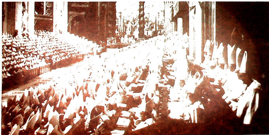
Fra åpningen av Det annet Vatikanekumenisk råd i Peterskirken 12. oktober 1962.

rapporten. «Det synes oss stadig klarere at gjeldende regler for et ekteskaps gyldighet (i det minste blant dømte ikke-katolikker) vanskelig kan opprettholdes, ja, at det snarere er gyldigheten av et ekteskap som bør bevises enn ugyldigheten. Fra et pastoralt synspunkt er den vanskeligste følge av den høye skilsmisseprosent det stigende antall gjengifte skilte. Vanskelighetene tilspisser seg i det økende antall gjengifte skilte (eller ektefeller av slike) som ber om opptagelse i Kirken. Vi ber om at dette problemkompleks blir betraktet som et åpent spørsmål inntil man er kommet frem til større klarhet i dette vanskelige kirkelige anliggende.»