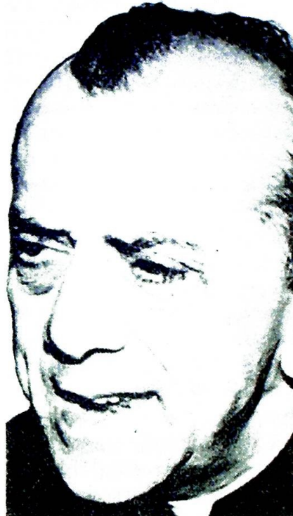
Biskop Helder Camara - utrettelig talsmann for de fattiges rettigheter - nylig i Oslo i anledning utgivelsen av hans bok «Tusen grunner til å leve.»

Denne våknende sosiale bevisstgjøring innen Den katolske kirke kan settes ved siden av tilsvarende erfaringer innen de protestantiske og ortodokse kirker. I etterkrigsårene dannet protestantene og anglikanerne Kirkenes Verdensråd (1948), som den ortodokse kirke sluttet seg til tidlig på seksti-tallet. På samme tid som katolikkene ble seg bevisst sin sosiale oppgave i løpet av Det annet Vatikankonsil, begynte de protestantiske og ortodokse kirker å uttrykke sine internasjonale sosiale anliggender gjennom Kirkenes Verdensråd. På grunnlag av denne felles bevisstgjøring begynte en meget fruktbar meningsutveksling om sosiale spørsmål mellom de forskjellige kirkesamfunn, og spesielt mellom Kirkenes Verdensråd og Den katolske kirke. Et konkret samarbeid ble inngått i