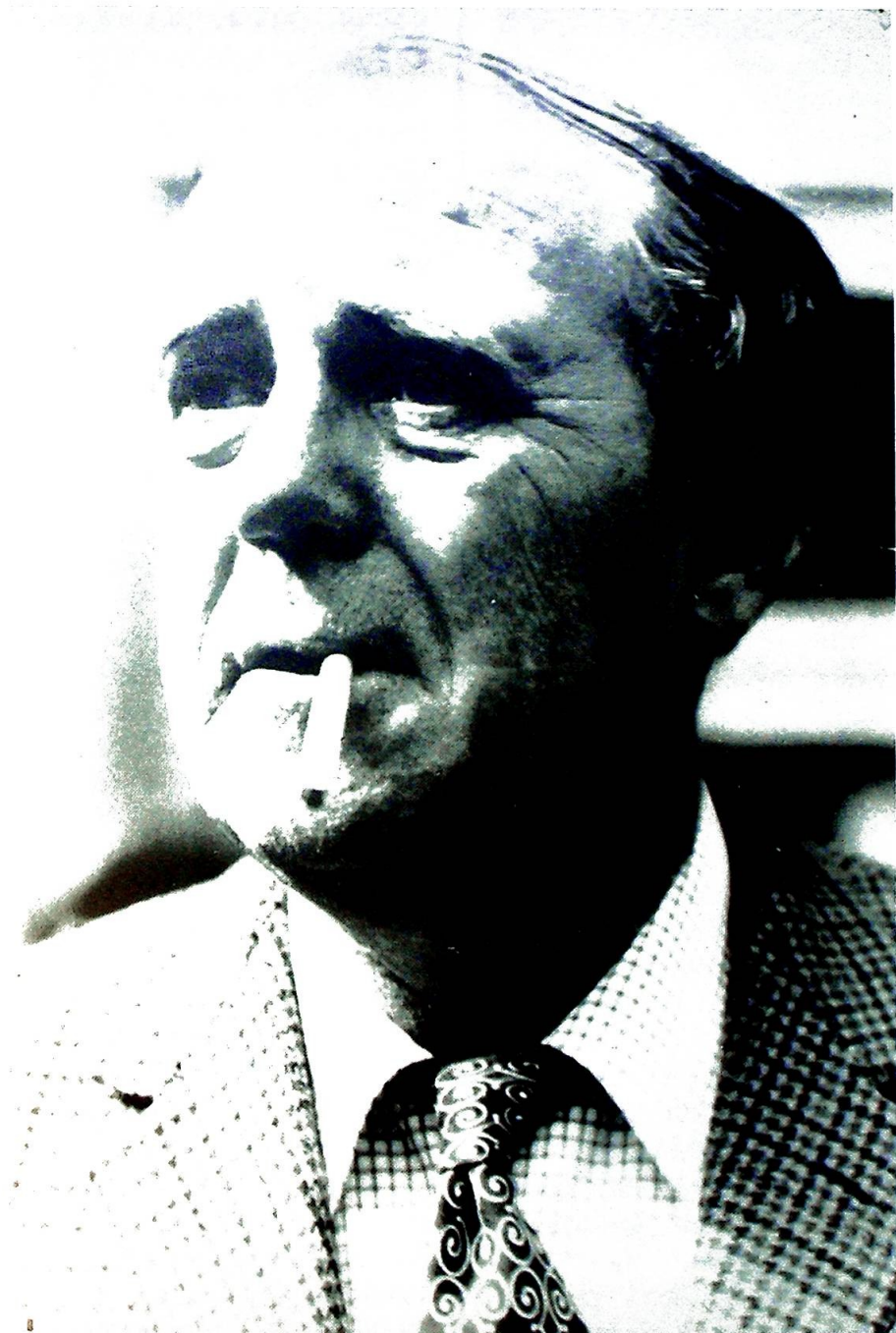
Heinrich Böll - Nobelpriisvinner og protestkatolikk, med ettertrykk både på protest og katolikk...

gen av Kölnerdomen, og - som han selv - opplever de helst kirkens skyggesider: Avstanden mellom det kirken burde være, og det den faktisk - dessverre - ofte er. Eller for å si det klassisk: diskrepansen mellom ideal og virkelighet.