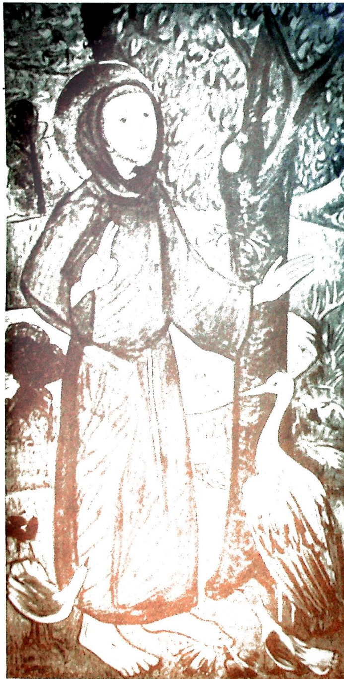
Den hellige Frans preker for dyrene - av Meinolf Splett

Å realisere seg selv er å ha mot til å stige ned til de dybder i oss der Gud har kastet sitt anker, der Ånden har tatt bolig i oss. Åndens lengsel er å rekonstruere Guds bilde i oss, å bringe oss tilbake til fellesskapet med Gud og med hverandre, å forvandle våre syke og splittede liv til et liv etter