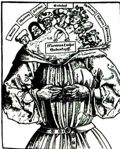
Luther-mannen med de syv hoder: Doktor - Martin - Luther - Kirkelærer - Svermer - Visitator - Barrabas.

Fra en anti-luthersk pamflett av J. Cochläus.