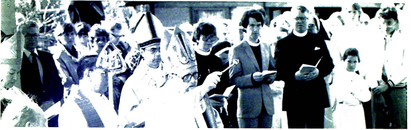
Fra innvielsen av St. Eysteins kirke i Bodø i 1983.

i kirken - og forlate den hvis de ikke får uttrykke seg på sin måte?