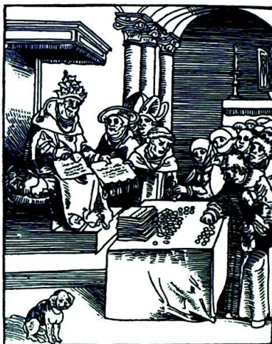
Karikatur av paven som selger avlatsbrev.

I begynnelsen av april innledet Amnesty International en av sine hittil største aksjoner: for å bekjempe tortur. Dels ved å legge fram nøyaktige opplysninger om hva som egentlig skjer i dagens verden, i fengsler og fangehull i et stort antall land, dels ved å legge fram et