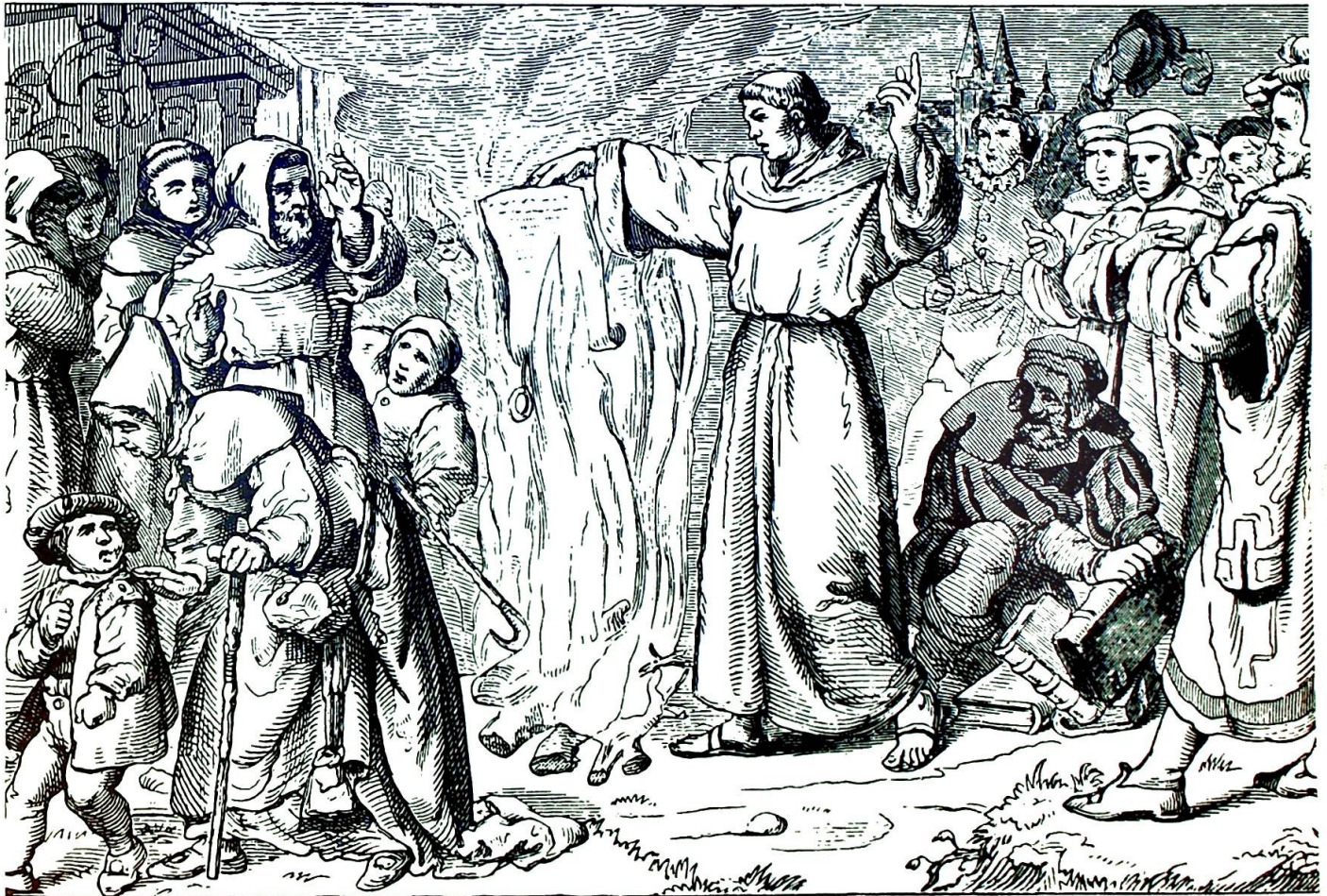
Den 10. desember 1520 stadfestet Luther sitt opprør mot Romas autoritet ved å brenne paven's bulle, Exurge Domini , foran universitetsbyen Wittenbergs murer.

og sykdomstæret, reiste seg fra sin benk i Kammeret og med sin hule dødingestemme slynget ut det profetiske rop: «Ve de fattige!», da varslet han like meget Stalin, Hitler, Mussolini og Franco som monopolenes og trustenes menn. Han