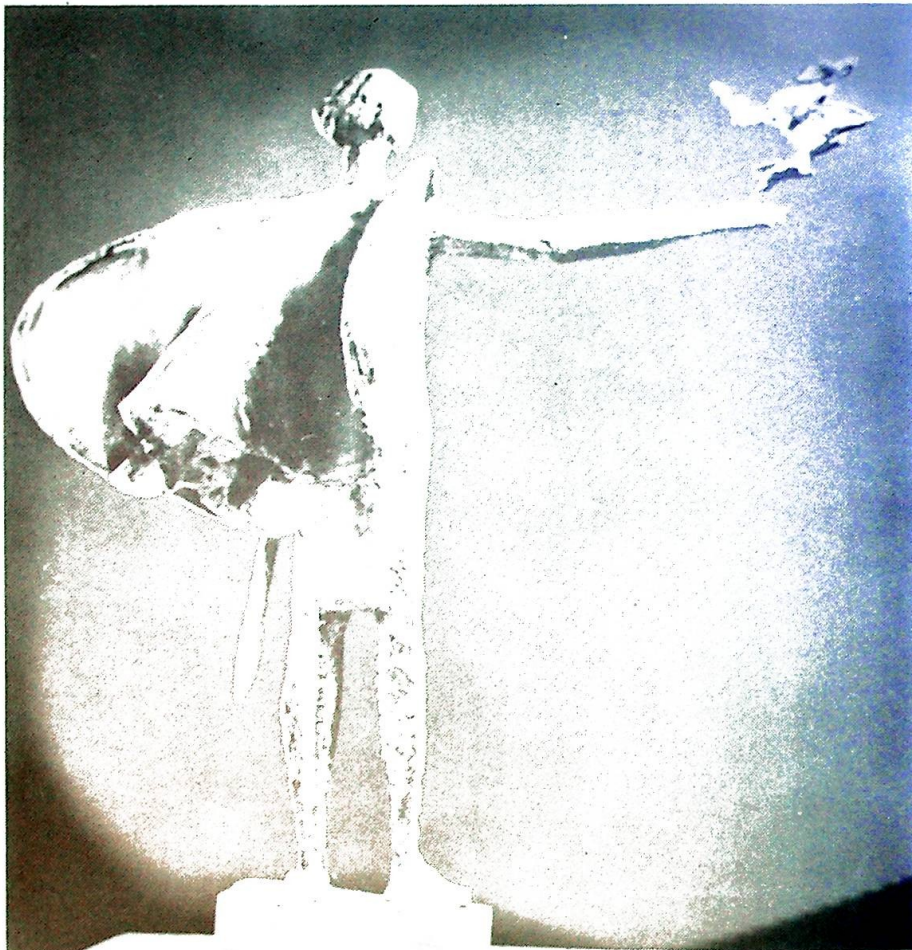
«Enhver kunstner har et innhold i seg, og dette innholdet kommer frem under og i arbeidet med det enkelte verk, selv om du kanskje underveis er mer opptatt av form og rytme.» Bildet viser «Olav Kyrre» (Sveiset messing, 1969).

ble offentliggjort i forbindelse med Verdens miljøverndag den 5. juni, slår fast at mellom fem og ti millioner kvadratkilometer i Europa og Nord-Amerika er i ferd med å bli ødelagt av denne forurensningen. Alt liv er blitt drept i hundrevis av sjøer, og mange byggverk - blant andre noen av verdens mest berømte oldtidsmonumenter er sterkt forringet. Skoger og avlinger lider skade og menneskenes helse utsettes for fare.