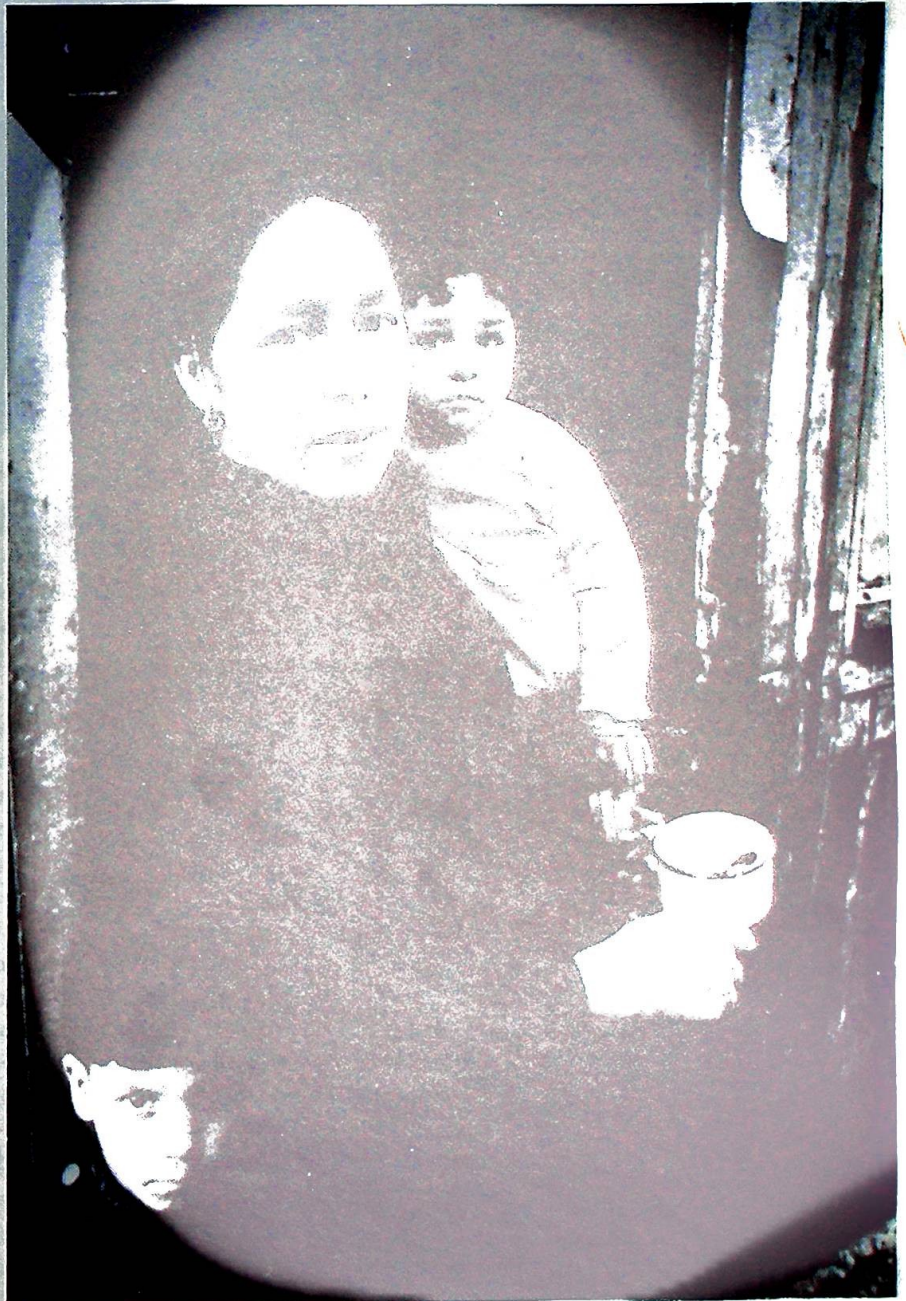
Sivilisasjonens pris: sammenbrudd av naturens egen fødselsregulering?