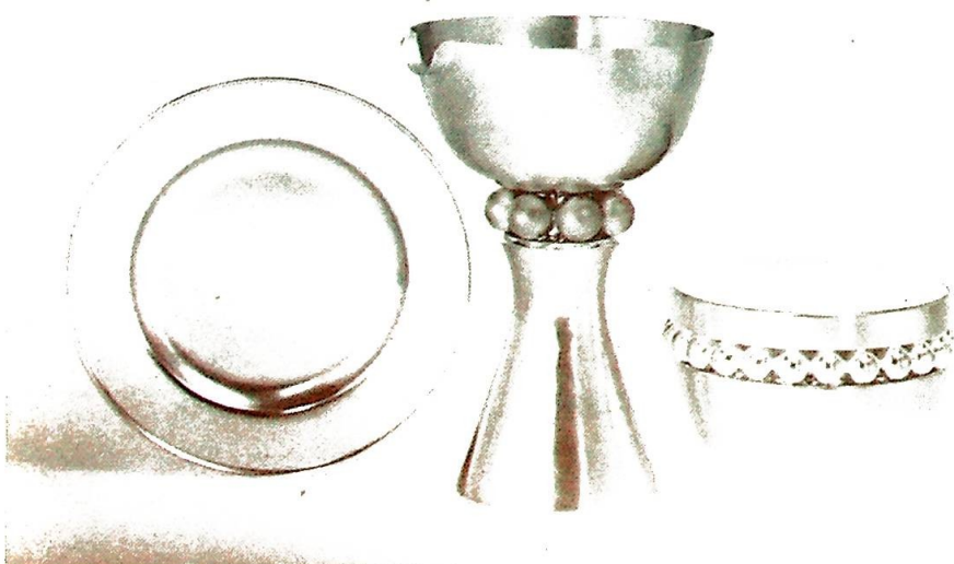
Et nattverdsett tegnet for David-Andersen til bruk i Den norske kirke.

Kirkeakademiet i Oslo arrangerte på vårparten et møte som tok opp temaet kirkekunst, og man kan håpe på lignen-