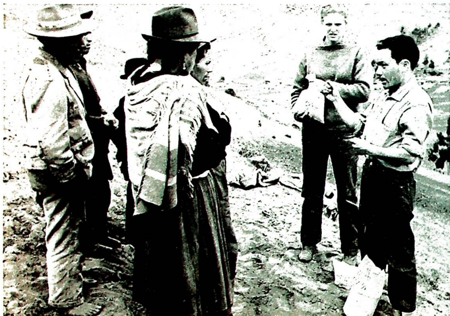
Det kan volde problemer å få den berømte dråpe i havet utnyttet mest effektivt.

Et av det internasjonale samfunns største problemer i dag er hvorledes vi på en effektiv måte kan hindre at store befolkningsgrupper verden over rammes av sult og hungersnød. En ILO-utredning foreslår at vi skal begynne med å undersøke hva fattigdom egentlig er.