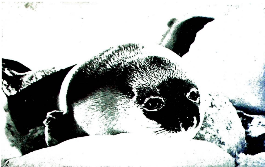
Dyr har sin egenart, som må respekteres!

— Han ville sikkert blitt like rasende som Kristus da han drev pengeskremmerne ut av templet! —