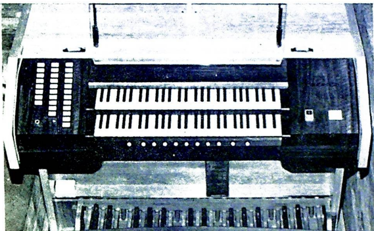
Spillebordet på det nye orgelet er helt i moderne stil.

Orgelet er en gave, men transporten av de mange piper og andre deler, små såvel som store, samt ikke minst oppstilling og montering, har kostet mange penger. Det er derfor opprettet et orgelfond, hvor det allerede nå har kommet betydelige beløp til. Ved konserten den 8. september skjenket således alle medvirkende kunstnere sitt honorar til fordel for saken.