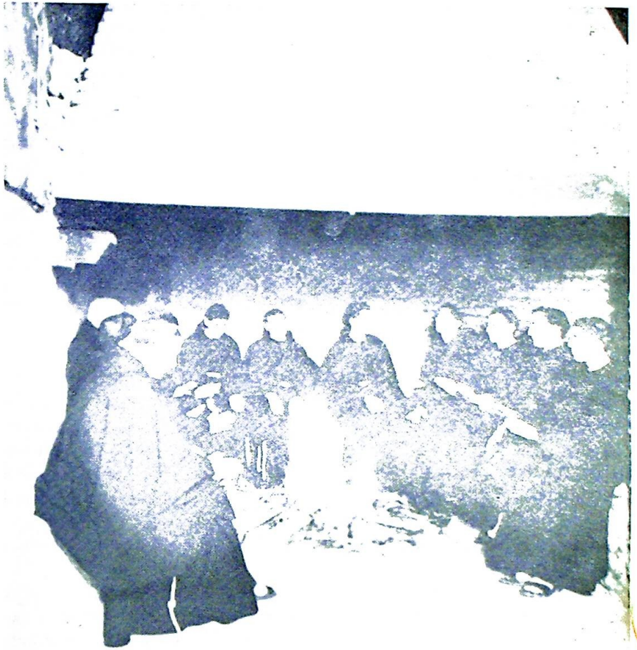
Fellesskapet og det alment menneskelige sto sentralt hos Franciskus fra Assisi.

I H. C. Andersens historie «Nattergalen» forekommer det også en kunstig nattergal, og de fleste foretrekker den, fordi man kan la den synge akkurat når man selv vil, dessuten er sangen alltid den samme, den har ikke dette uberegnelige og litt urydige som det er over den levende nattergalens sang. Men mens folk flokker seg beundrende omkring kunstfuglen, flyr den virkelige nattergalen bort i et ubevoktet øyeblikk. — La det ikke gå oss likedan. Husk at da det gjaldt livet, da keiseren lå døende, var det den levende nattergalen som reddet ham.