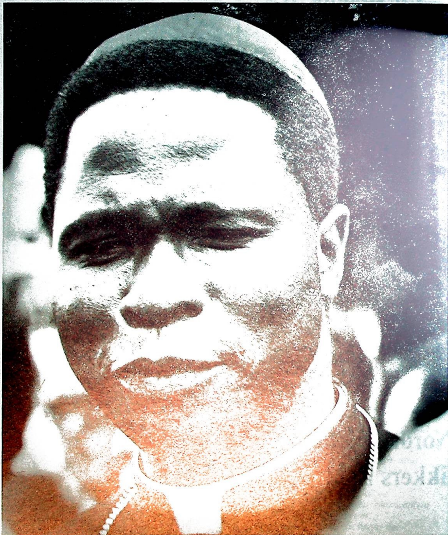
Bernardin kardinal Gantin, pavens stedfortreder i Lourdes.

tok initiativet til. Den afrikanske kirke vi møter i dag, fortsetter kardinalen — biskopene, prestene og legfolket, som er åpne overfor verden og for andre kulturer, er seg bevisst sin egen kulturelle rikdom, og det er opp til oss å utvikle denne, gjøre den kjent og verdsatt. Dette er en av våre første oppgaver, men det må alltid gå hånd i hånd med evangeliseringen. Vi må ikke blande det sammen — vår oppgave som afrikanske kristne er å forkynne evangeliet ut fra