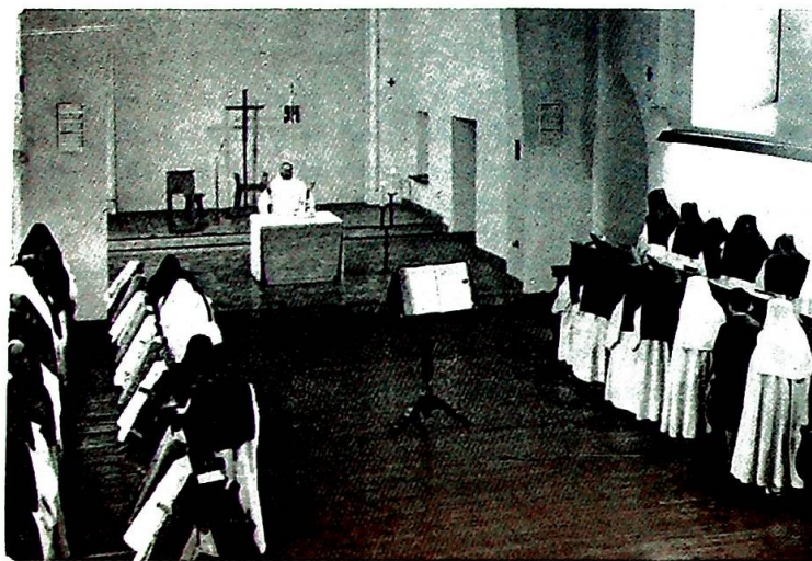
Den hellige messe og korbønnen er den åndelige krumtapp om hvilket alt dreier seg i et kontemplativt kloster.

Jeg reiste til Laval med forventning om en stor opplevelse, men kanskje uten særlig håp om å få personlig hjelp. Den middelaldrende er pr. definisjon en uinteressant person. Det er noe annet med en ung som kan