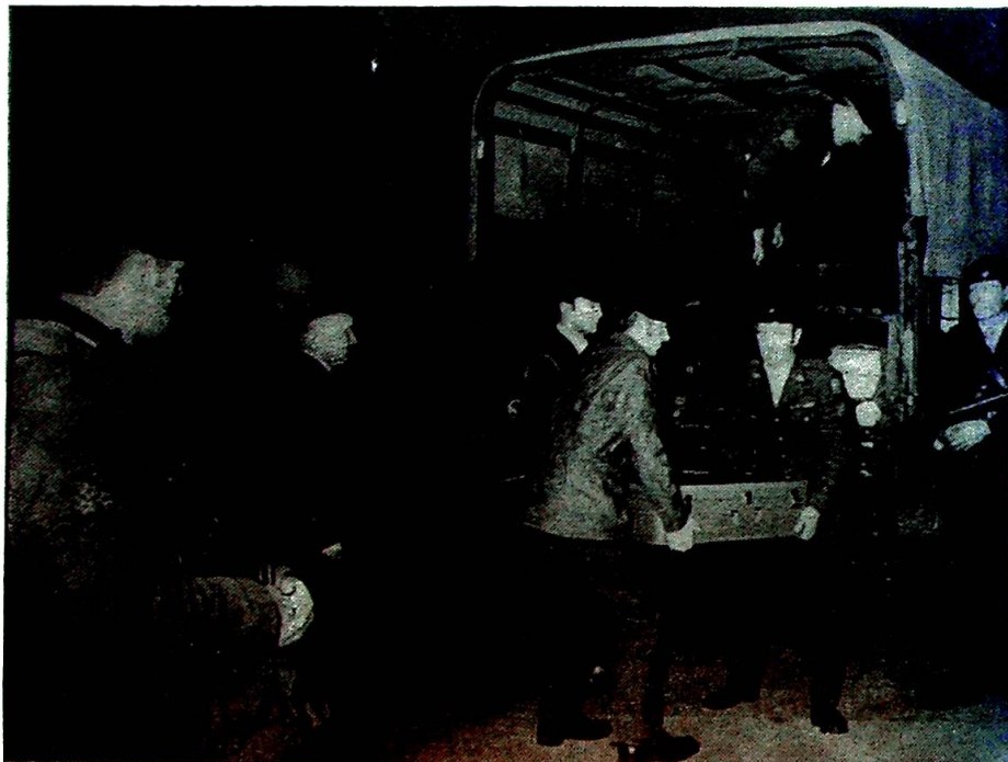
Er våpenkappløpet også en etisk utfordring til de som bekjenner seg til kristendommen?

— Konfirmantundervisningen må bruke eksempler fra den verden unge