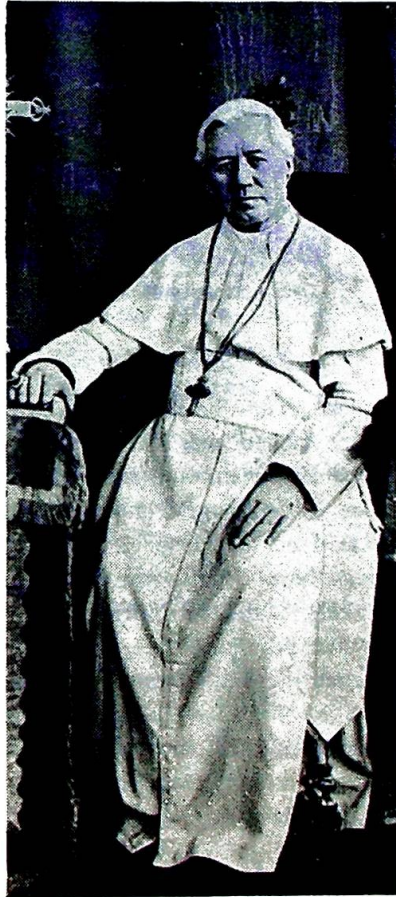
Pavene har selv i nåtiden tatt initiativ til å reformere kirkeretten.

Eller ta trafikkreglene som eksempel. Det er et generelt, etisk prinsipp at enhver må kjøre hensynsfullt og ikke bringe sine medtrafikanter liv i fare. Så kommer myndighetene i de enkelte stater og bestemmer de nærmere detaljer: at alle alltid skal kjø-