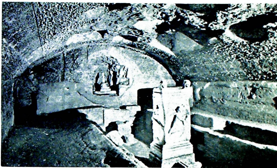
Under kirken finnes restene av et romersk mithratempel.

De middelalderske kirkemosaikkene ble som regel utført av arbeidslag av spesialister. Mellom disse var det ofte en klar arbeidsdeling. Noen var f. eks. spesialister på tilhogging av flisene. Glass (smalto) og marmor ble hogd mot en jernplate. Også blant steinsetterne fantes spesialister på f. eks. menneskeskikkelser. Det mest anvendte format på tesserae var 1-2cm 2 , men til enkelte detaljer krevdes det langt mindre tesserae. Fargen i glasset framkom ved å tilføye jernoksyder, og en kunne oppnå en variasjon fra transparent til mettet. For gull- og sølvtesserae trengtes en egen framstilling: Et tynt hamret lag av metall spentes ut på et flytende lag av glass (svakt farget), og oppå tilføy-