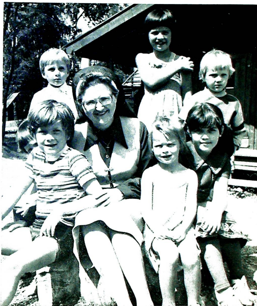
Sr. Avita med noen av sine mange unger.

Mistenksomhet ble ryddet av veien og St. Torfinns Barnehage er i dag en moderne og veletablert barneinstitusjon. Barnehagen var en lokal institusjon. Det er den ikke mer. Det kreves i et moderne samfunn en stor teknisk og menneskelig innsats for å