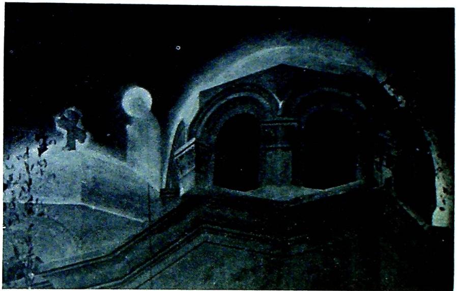
«Nonnen» viste seg på kirkens tak, hvor hun spaserte rundt mellom kuplene.

Man kan selvfølgelig si, at det ikke var noe tilfelle, at det var et par mus-