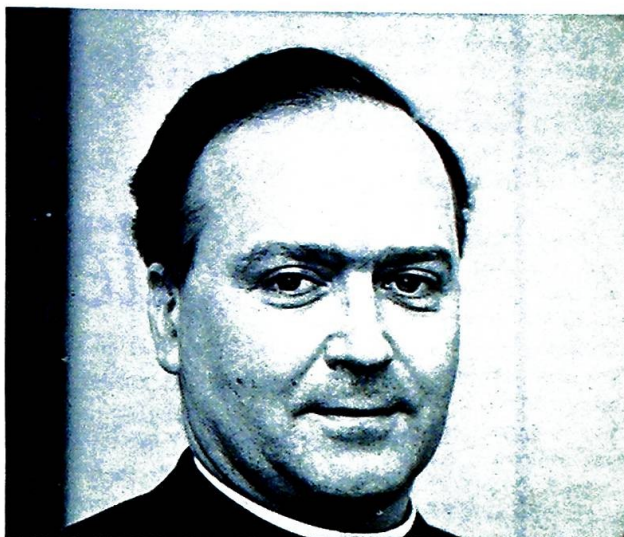
Biskop Gran sier, at man fra nordisk side hadde full frihet til å kjøre opp med merkesaker ... men at proposisjonene inntil videre er hemmelige og ikke kan offentliggjøres.

Flere synodefedre mente dagens påholdende regler for annullering av ugyldige ekteskap var alt for vanskelige, og etterlyste forenkling av denne (i sannhet kompliserte) prosedyre. Noen gikk dypere og satte spørsmålstegn ved den sakramentale karakter som skal hefte ved alle ekteskap inngått mellom døpte ikke-katolikker i overensstemmelse med den sivile ekteskapsordning. Spørsmålet som ble