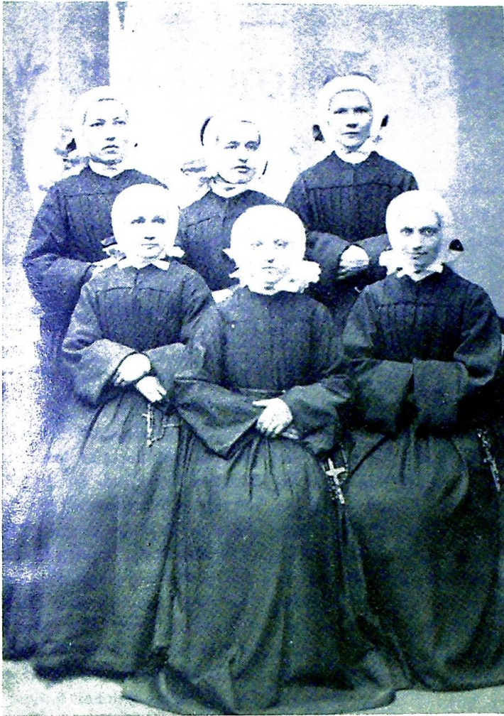
St. Elisabethsøstrenes første kommunitet i Trondheim.

ter godt kunne utføres på heltid, hvis Vårherre vil det. Opprinnelig hadde man ikke tenkt i så store baner som å sende søstre til det nordligste nord. De første søstre tenkte seg et arbeide av mer lokal karakter, så som sykepleie og skolegjerning i den saksiske diaspora, som nettopp i 1840 årene var på vei inn i en ny tid i sporene på den nasjonal-revolusjonære vind som blåste over Europa.