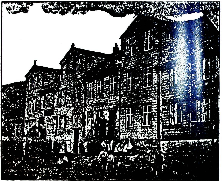
St. Vincents Hospital i Hammerfest for hundre år siden.

Det har ikke vært helt gratis. Og med gratis menes ikke her det vi i alminnelighet forstår ved dette ord. Det kostet, om enn ikke blod, så i hvert fall et umåtelig slit og en lang arbeidsdag. Nå synes det som om søstrene har en liten sjanse for å få litt hvile, idet de med stolthet kan overlate deres tidligere arbeidsplass til samfunnet og peke på at det første bud i sykepleien, før som nå, er