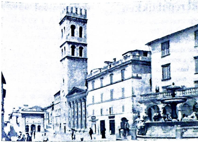
Torvet i Assisi.

hilsen av en nonne i rullestol, begge ben var amputert etter en bilulykke. Hun presenterte en datter som var dverg, og en irsk mann bodde der med to sønner. To sortkledte munkere var visstnok tidligere biskoper, som ønsket et stillere liv, ble det sagt av en annen besøkende.