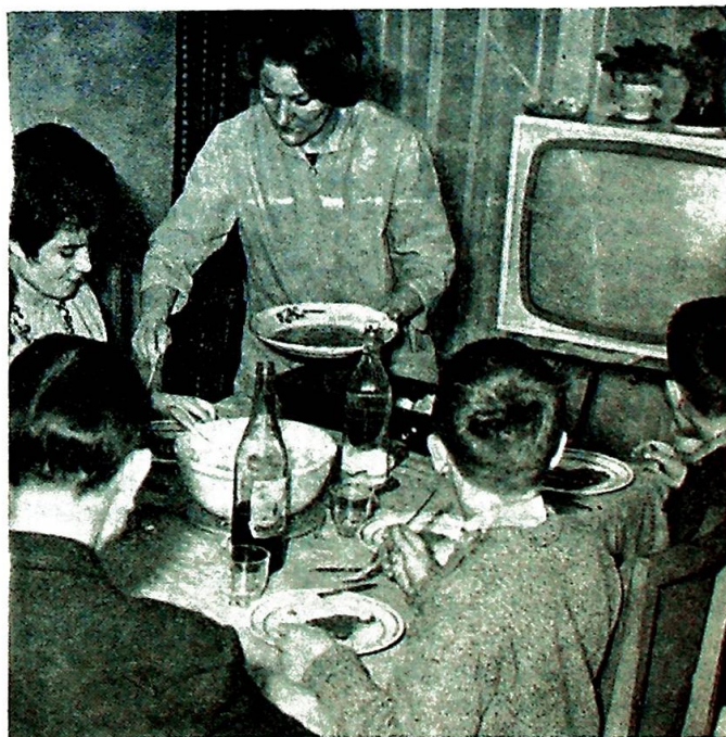
Familien er stadig den faste kjerne omkring hvilken det kristne samfunn også i en sekularisert verden må bygges opp.